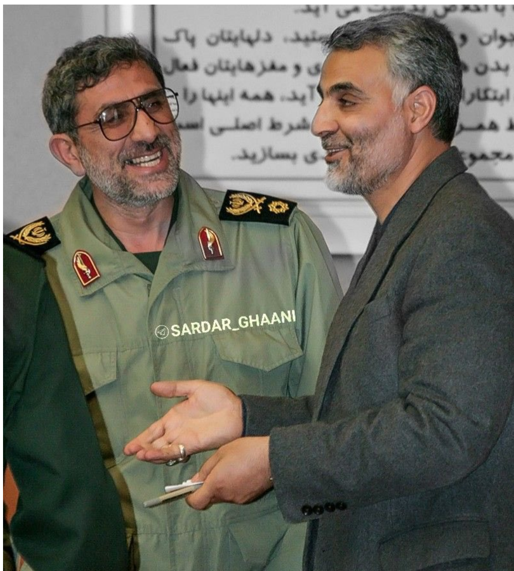
Les deux commandants de brigade IRGC-Quds, Qassem Soleimani et Ismail Qaani.

monde, il a choisi plutôt de mettre au défi une superpuissance qui a déployé des dizaines de bases militaires encerclant l'Iran. Le coût de l'assassinat de Soleimani entrera dans les livres d'histoire comme le signe du déclin de l'empire américain, lorsqu'un petit pays possédant une capacité militaire relativement limitée a mis au défi et frappé une superpuissance dont les forces armées sont déployés dans le monde entier.