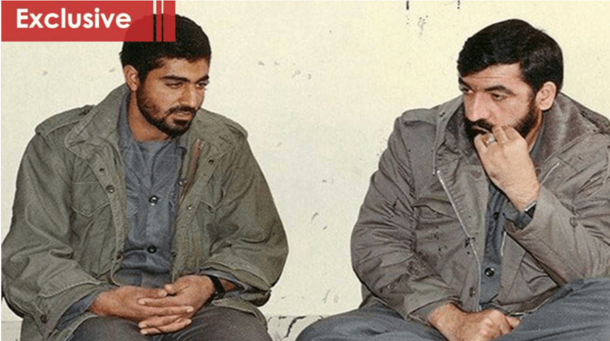
Qassem Soleimani avec le général Mohsen Rezaei

À Damas, Qaani a rencontré des dirigeants palestiniens pour reconfirmer ce qui a été convenu à Téhéran et l'engagement de l'Iran à soutenir la cause palestinienne. Qaani est également allé au Liban, où il s'est entretenu avec le secrétaire général Sayyed Hassan Nasrallah, puis en Irak pour voir des responsables, comme le faisait son supérieur Qassem Soleimani avant sa mort. L'officier iranien a livré le même message à tous les membres de l'Axe de la Résistance qu'il a rencontré : l'Iran considère l'Axe de la Résistance comme faisant partie de sa sécurité nationale et est déterminé à accroître son soutien à ses alliés au besoin. Le chef de la brigade Al-Qods du Corps des gardiens marche sur les traces de son prédécesseur Qassem Soleimani en tissant des relations personnelles avec ses alliés.