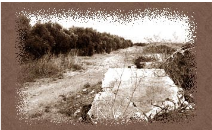
Bisan, ce qui reste du village

Les Palestiniens se réfugient au Liban, en Syrie, en Cisjordanie et Transjordanie, dans la bande de Gaza... en majorité dans des camps, sous des tentes avec des conditions climatiques, alimentaires et sanitaires très difficiles.