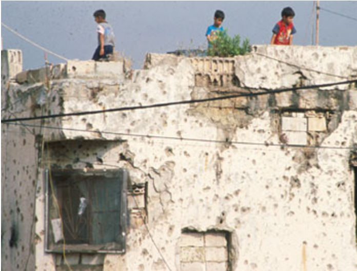
Camp palestinien de Chatila au Liban

L'éducation des enfants, principal capital des Palestiniens, est aujourd'hui menacée.