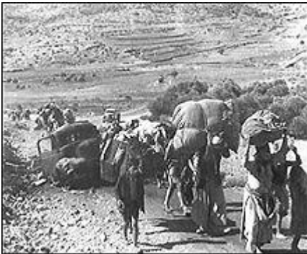
Fuite des survivants de Deir Yacine

Les massacres sont nombreux comme celui de Deir Yassine : 250 morts.