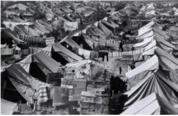
Les premiers réfugiés en 1948