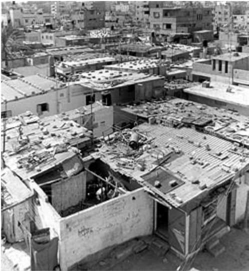
« Amélioration » : Beach camp à Gaza

Pour être admis à l'ONU, l'état israélien accepte en 1949 la Résolution 194 reconnaissant le droit au retour des réfugiés palestiniens mais s'est depuis toujours opposé à la mise en œuvre de ce droit universel, chassant, tuant ou exilant de nouveau les réfugiés qui avaient réussi à revenir.