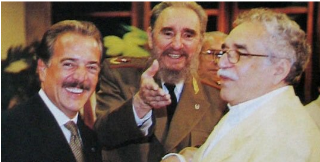
Photo : Andreas Pastrana, Fidel Castro et Gabriel Garcia Marquez

35. En 1994, Gabriel García Márquez joue un rôle-clé dans le rétablissement des relations diplomatiques entre la Colombie et Cuba, rompues en 1981.