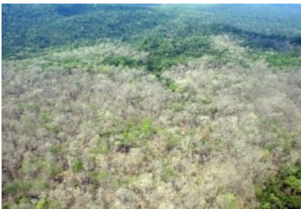
Une partie de la forêt amazonienne empoisonnée par l'Agent Orange

« Agent Orange est l'une des armes les plus dévastatrices de la guerre moderne, un produit chimique qui a tué ou blessé quelque 400.000 [hélas, bien davantage !] personnes au cours de la guerre du Viêt Nam - et maintenant il est utilisé contre la forêt amazonienne. Selon les responsables, les éleveurs au Brésil ont commencé la pulvérisation de l'herbicide hautement toxique sur des parcelles de forêt comme méthode secrète pour effacer illégalement feuillage, plus difficiles à détecter que des tronçonneuses et des tracteurs. Au cours des dernières semaines, un relevé aérien détecté quelques 440 hectares de forêt qui avaient été pulvérisés avec le composé - empoisonnant des milliers d'arbres et un nombre incalculable d'animaux selon IBAMA (Agence de l'environnement du Brésil) - ont d'abord été pressenti pour le défrichage illégal constaté par des images satellites de la forêt en Amazonie. Plus tard, un survol en hélicoptère dans la région révéla des milliers d'arbres laissés couleur de cendre et défoliés par des produits chimiques toxiques. IBAMA déclare que l'Agent Orange a probablement été dispersés au moyen d'un avion par un fermier encore non identifié pour défricher la terre pour le pâturage, car il est plus difficile à détecter que les opérations traditionnelles qui nécessitent des tronçonneuses et des tracteurs.