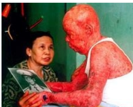
Ancien militaire vietnamien tenant son portrait avant sa contamination par l'Agent Orange