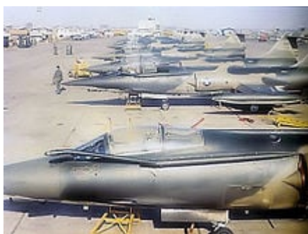
1965, Base de Da Nang, Chasseurs-bombardiers MacDonnell Douglas, Phantom 104 C.

Après un long débat, le Congrès américain a adopté, et le Président Obama a signé, le projet de loi FY11 d'un montant de 18,5 millions de dollars. Cependant, 34 millions de dollars sont nécessaires - en première estimation - pour une surface à traiter de 3 hectares et demi seulement sur l'ancienne base américaine de Da Nang. Or, les USA se sont débrouillés pour prendre à leur compte moins de la moitié de ce coût, soit 15,5 millions, allouant par ailleurs les 3 autres millions à des programmes liés à la santé... mais probablement par l'intermédiaire d'organisations étasuniennes comme East Meets West , Save the Children et Assistance au Vietnam pour le Handicap , car le Président de l' Association Vietnamienne des Victimes de l'Agent Orange/Dioxine (VAVA) a déclaré dernièrement que pas un centime n'était arrivé à ce jour.