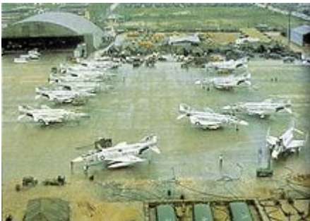
Janvier 1966, Base de Da Nang, parking de chasseurs-bombardier US, McDonnell Douglas, Phantom 4B.

Si une réelle volonté étasunienne débloquent les moyens financiers nécessaires, il y a longtemps que décontaminations et dédommagements seraient avancés, voire partiellement réglés. Mais les USA nient et renient leur crime d'hier engendrant la tragédie d'aujourd'hui et tirent avantage de cette situation. Ils laissent miroiter l'espoir d'une aide conséquente et adaptée qui ne vient jamais, attribuant un financement de dépollution au compte-gouttes, de préférence aux entreprises US. Une manière qui permet de renforcer leur coopération avec l'ancien ennemi - facilitée par la crainte partagée de l'expansionnisme chinois - et à prendre pied sur le Viêt Nam dans leur continuelle avancée géostratégique et militaire à l'assaut de ce jeune siècle. Le Viêt Nam se trouvant au cœur de la région où il se jouera.