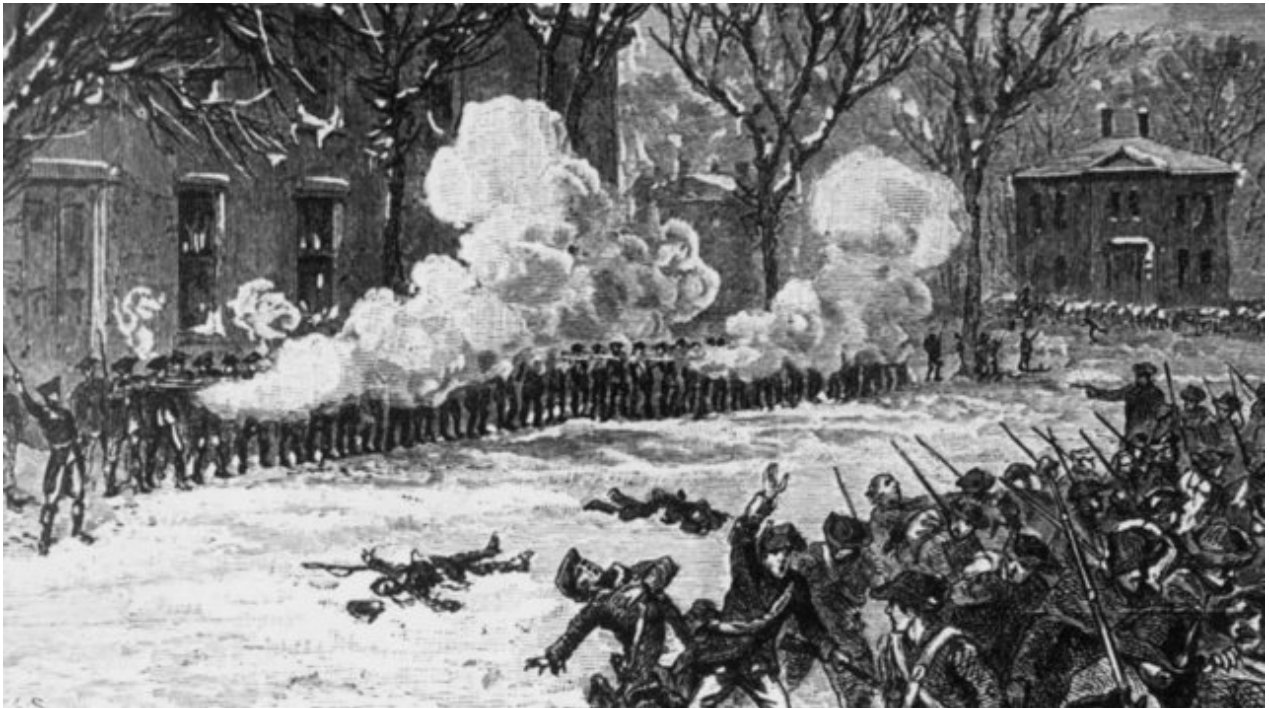
Rébellion de Shays, 1786

Massachusetts dans la dette étrangère des États-Unis. Daniel Shays, dont le mouvement porte le nom, était un ancien combattant non-payé. Il s'était retrouvé devant un tribunal pour non-paiement d'impôts.