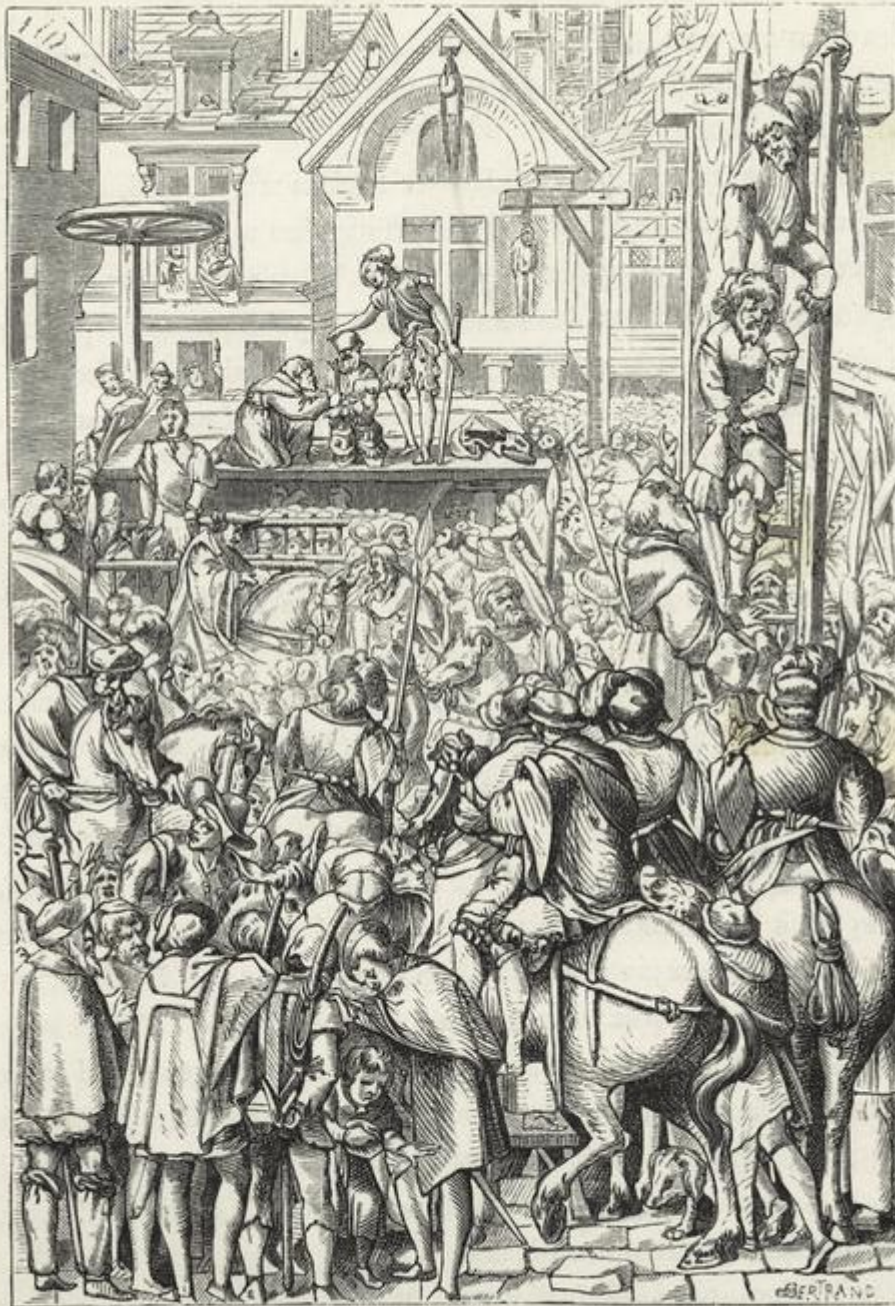
Fig. 347. — Les exécutions publiques. Fac-simile d'une gravure sur bois de l'ouvrage latin de J. Millæus, Praxis criminis persequendi , p. in-fol., Parisiis, Simon de Colines, 1563.