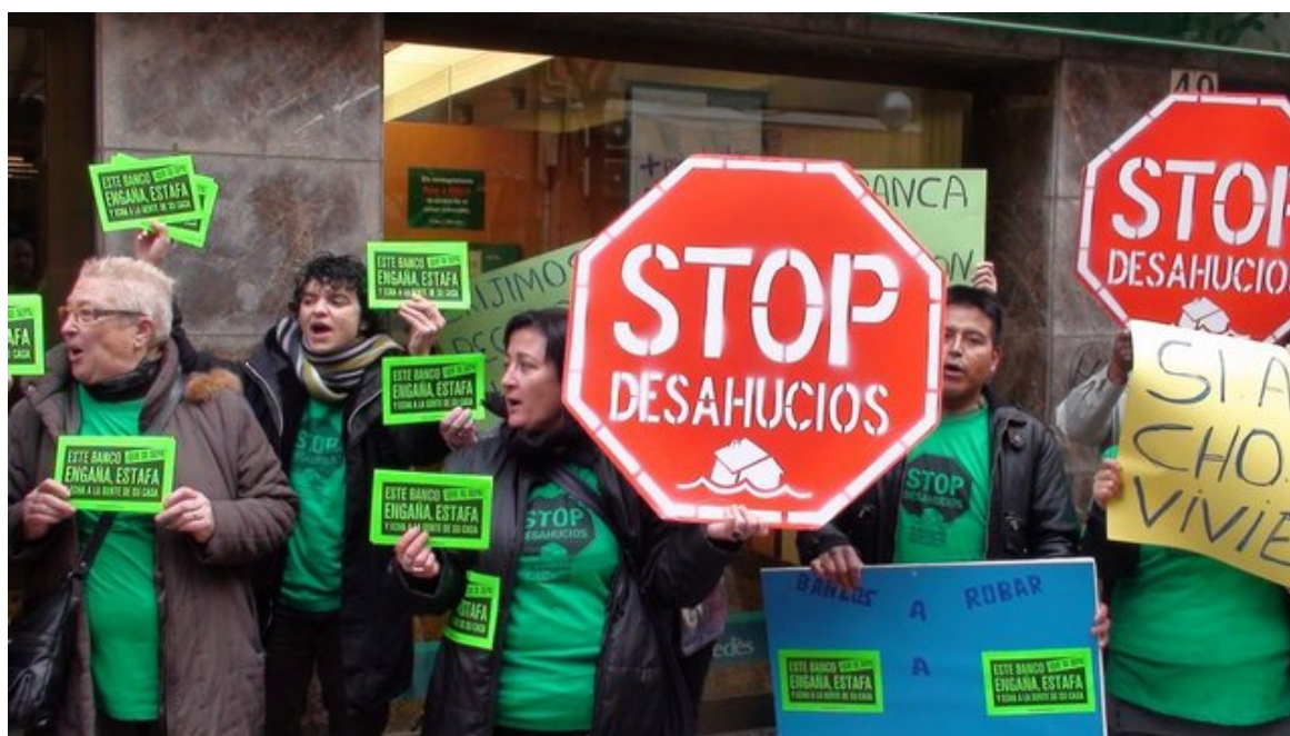
Manifestation de la « Plataforma de Afectados por la Hipoteca » (PAH)

libres pour expulser les familles incapables de payer leurs dettes hypothécaires [13]. Aux États-Unis, en Espagne, en Irlande, en Islande, en Grèce..., un nouveau type de mouvement et de mobilisations est né afin de résister à cette politique d'expulsion/dépossession.