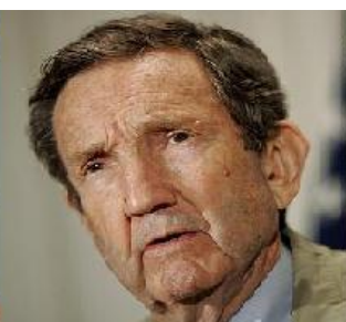
Ramsey Clark, avocat, ex-Procureur général des États-Unis