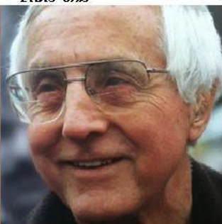
Thomas Gumbleton, Évêque catholique de Detroit (États-Unis) et activiste des droits humains