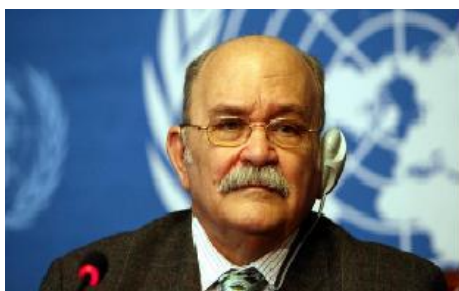
Miguel D'Escoto (Nicaragua), Prêtre catholique (Maryknoll), ex-Chancelier du Nicaragua, ex-Président de l'Assemblée Générale de l'ONU