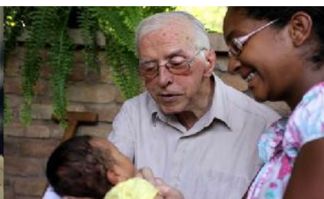
Pedro Casaldáliga, évêque d'Altava (Brésil), poète et théologien de la libération