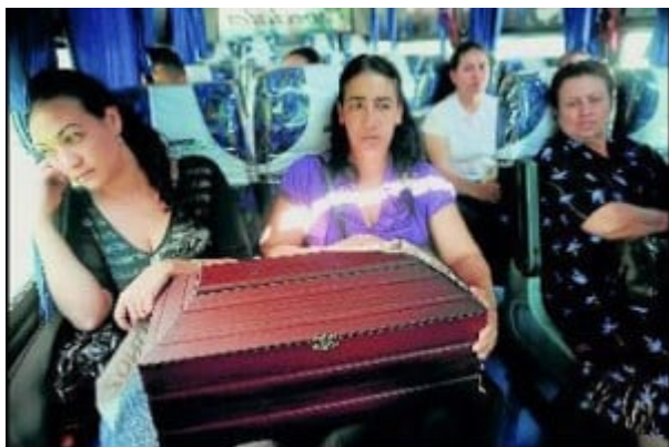
Familiares de víctimas de la herramienta paramilitar del Estado colombiano, tras recibir los restos de su ser querido

4. ¿ Denunciaremos los crímenes resultado de una planificación Estatal, o vamos a seguir promoviendo la confusión?