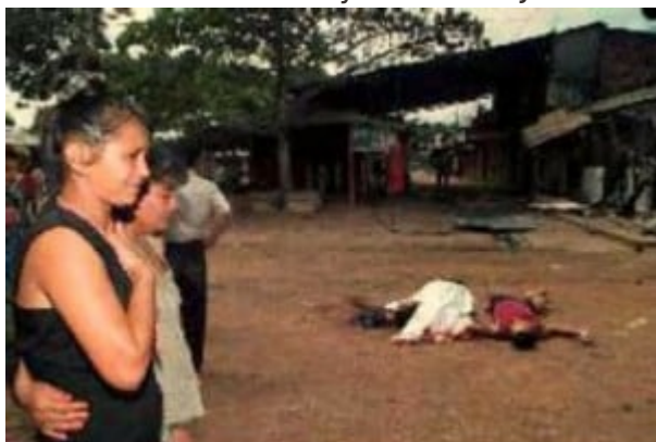
Masacre de Mapiripán, Colombia: unas 60 personas fueron masacradas por paramilitares y militares.