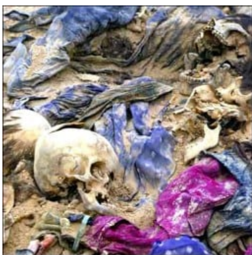
En Colombia se descubrió la mayor fosa común del continente, tras un batallón militar: contiene los restos de al menos 2.000 personas. Desde 2005 el Ejército ha estado enterrando allí a miles de personas desaparecidas. Foto: Fosa Macarena, Meta

El Terrorismo de Estado se expresa también en: 9.500 presos políticos [6]; la eliminación física de un partido político: La Unión Patriótica (5.000 personas asesinadas por las herramientas paramilitares y oficiales del Estado)[7]. El exterminio contra la oposición política es tal que: “En Colombia se cometen el 60% de los asesinatos de sindicalistas que se presentan en todo el mundo, por una violencia histórica, estructural, sistemática y selectiva que se convirtió en pauta de comportamiento del Estado colombiano” , según denuncia la CUT [8]. El Tribunal Sindical Mundial condenó al Estado colombiano: “por ser responsable de los hechos sistemáticos de violación del principio de libertad sindical, en calidad de autor directo, coautor, cómplice o encubridor de homicidios, lesiones, torturas, privaciones ilegítimas de la libertad, atentados(...)” [9].