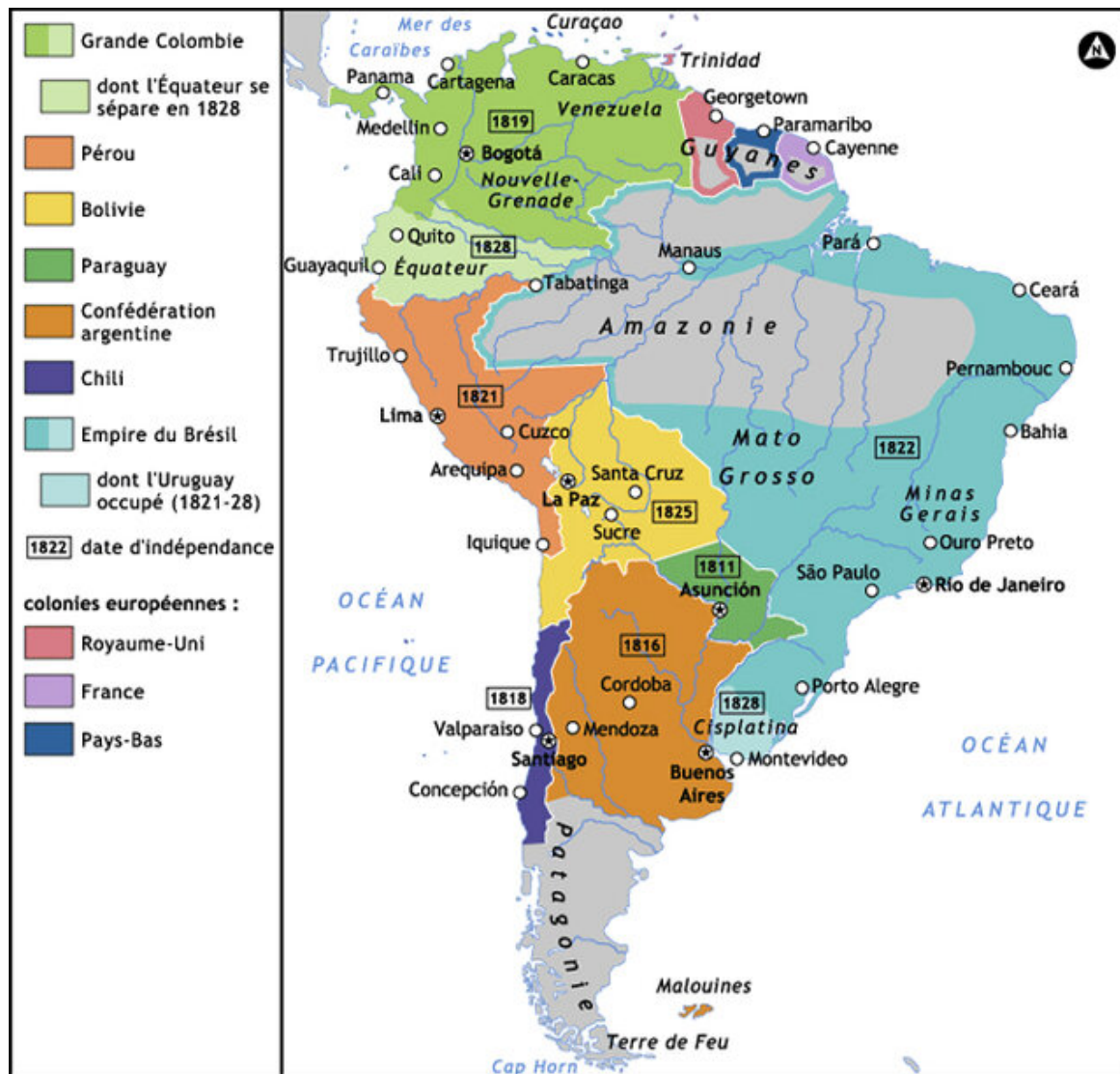
L'Amérique Latine des colonies aux indépendances

Les crises de la dette extérieure de l'Amérique latine du XIXe au XXIe siècle