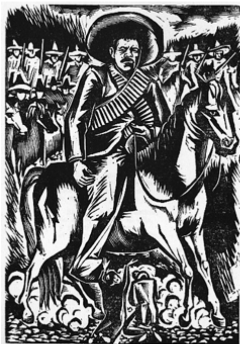
Pancho Villa - gravure de Leopoldo Méndez, 1934

armée pour obtenir le remboursement. Les restructurations de dettes ont servi à chaque fois les intérêts des créanciers et des grandes puissances qui les appuyaient et ont fait rentrer les pays débiteurs dans un cercle vicieux d'endettement, de dépendance et de « développement du sous-développement », pour reprendre une expression de l'économiste André Gunder Frank [3].