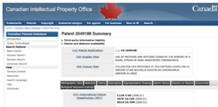
Captures d'écran - L'actualite/ic.gc.ca

Ainsi, ce brevet et les autres disponibles sur le net existent bien. Les laboratoires canadiens et autres ont bien des souches de coronavirus (ou virus corona) qui viennent des anciennes vagues virales, ils travaillent bien avec ces souches. Mais, ils n'ont pas volontairement (ou involontairement) contribué à sa propagation. Ca, en effet, ce n'est pas prouvé.