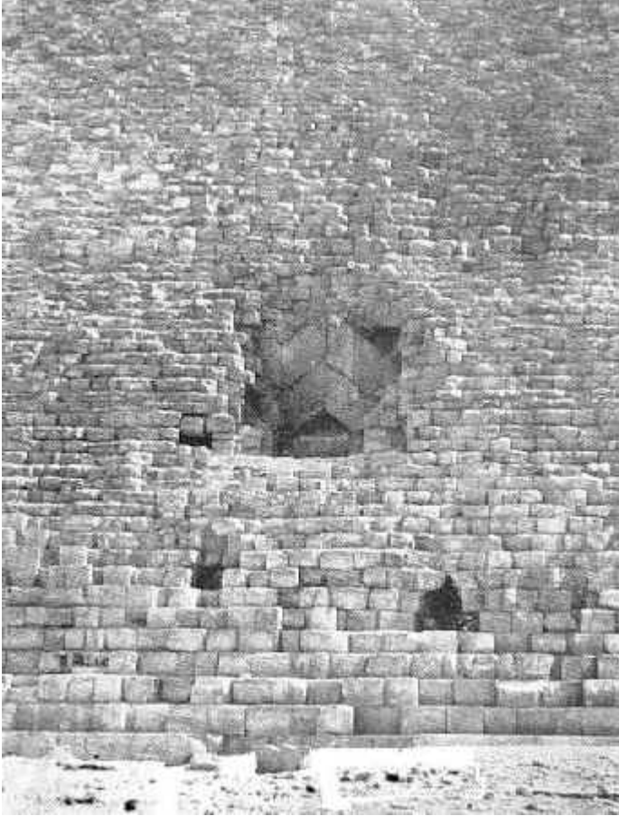
L'entrée « Al-Mamoun » de la pyramide de Khéops (Giza, Égypte)

Ajoutons à cela que l'historien, médecin et philosophe arabe Abd Al-Latif Al-Baghdadi (1162-1231) fit une description détaillée des vestiges pharaoniques. Dans son ouvrage « Relation de l'Égypte », considéré comme une des premières œuvres d'égyptologie, il donna moult détails sur la tête du Sphinx, son corps étant à l'époque enseveli sous le sable [10].