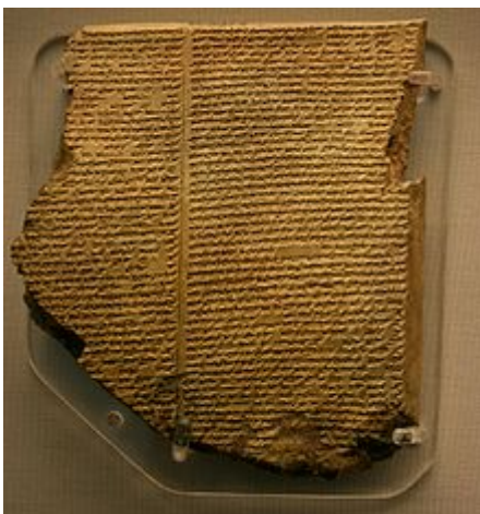
Tablette de la version ninivite de l'Épopée de Gilgamesh (British Museum)

Cette histoire, « aussi vraie que le ciel est peuplé d'oiseaux et que la mer de poissons » [1] nous est parvenue par-delà les âges, sans prendre une seule ride. La plus vieille œuvre littéraire de tous les temps, gravée en caractères cunéiformes sur une douzaine de tablettes en argile.