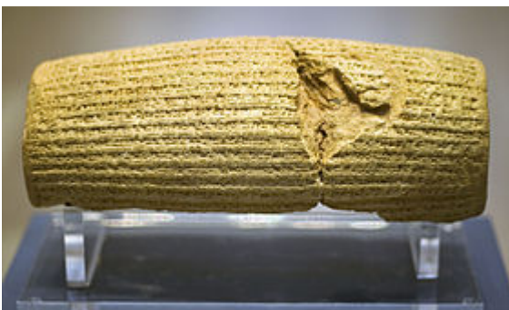
Le cylindre de Cyrus (British Museum)

Les différentes fouilles menées par Hormuzd Rassam ont permis de mettre au jour plusieurs autres trésors du génie humain dont le célèbre « Cylindre de Cyrus » (539 av. J.-C.) qui est considéré comme la « première charte des droits de l'homme ». En 1971, ce document gravé sur un cylindre d'argile a été traduit par l'ONU en chacune de ses six langues officielles [2].