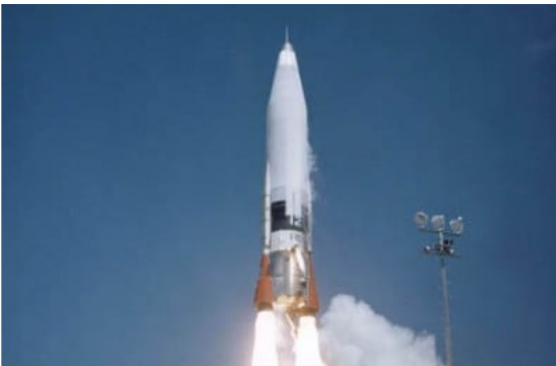
Essai d'un missile balistique intercontinental (ICBM) non armé : Lancement d'un missile nucléaire Minuteman III à partir d'un bunker souterrain sur la côte californienne (le 26 février 2016)

Les USA ont aujourd'hui 4500 têtes stratégiques, dont 1750 prêtes au lancement, plus 180 « tactiques » prêtes au lancement en Europe, plus 2500 retirées mais non démantelées. Avec les françaises et les britanniques, l'Otan dispose de 5015 têtes nucléaires, dont 2330 prêtes au lancement. Plus que la Russie (4490, dont 1790 prêtes au lancement) et que la Chine (300, aucune prête au lancement).