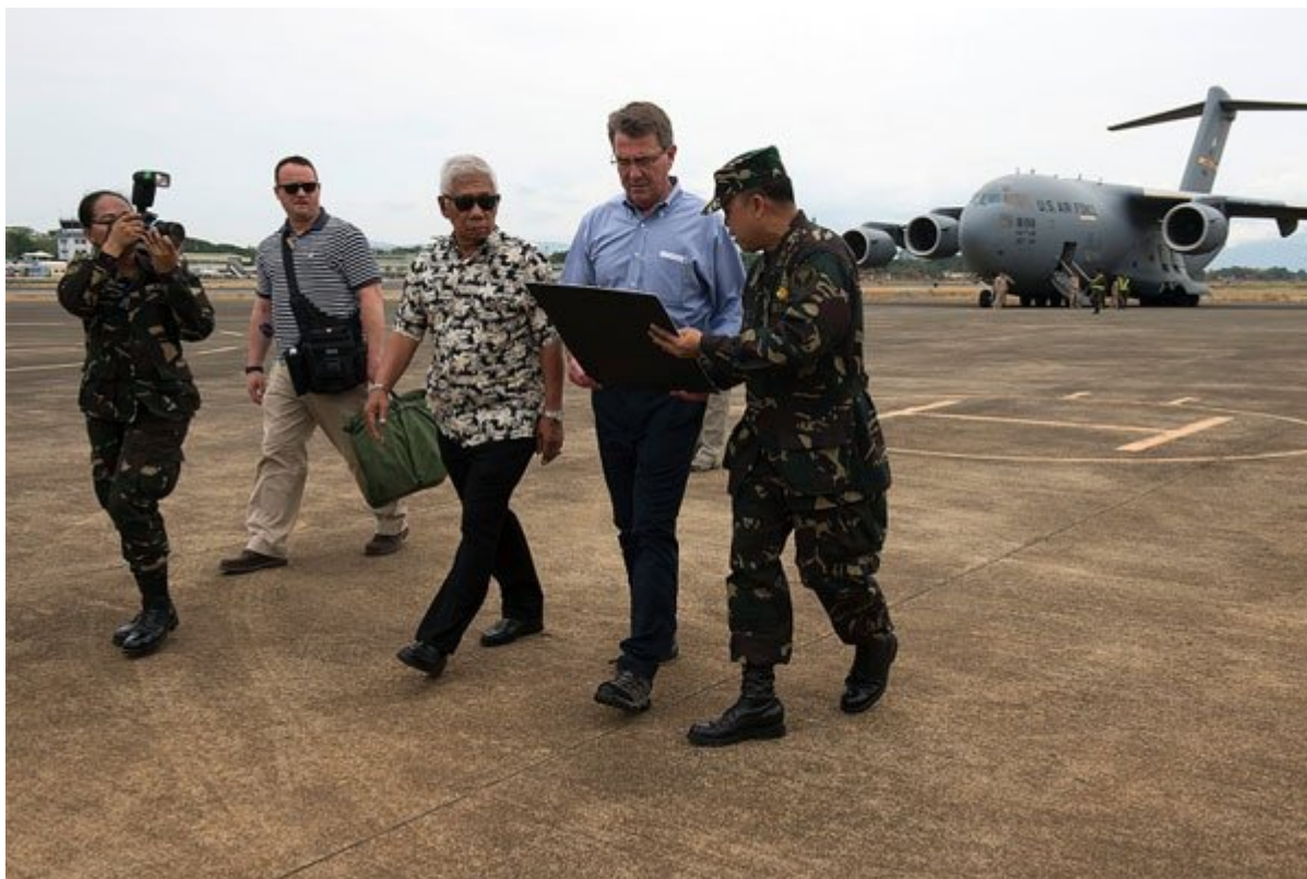
Le Secrétaire de la Défense Ash Carter et le secrétaire philippin de la Défense nationale Voltaire Gazmin examinent les futurs plans de coopération de défense l'aéroport Princess Puerto à Palawan, Philippines, le 15 avril 2016 Avril.

laboratoires avec un personnel de plus de 40 mille personnes. La course aux armements nucléaires relancée, Obama a proclamé à Hiroshima la volonté d' éliminer non seulement les armes nucléaires, mais la guerre elle-même : rappelant que « les gens ordinaires ne veulent plus de guerres », il a souligné que « c'est notre mentalité même sur la guerre que nous devons changer, pour prévenir les conflits grâce à la diplomatie ».