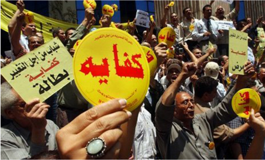
Le Caire: manifestation de militants du mouvement « Kifaya » (كفاية)

Cette étude réalisée par le RAND a servi de fondement pour une politique américaine d'« exportation » de la démocratie vers les pays de la région du Moyen-Orient et de l'Afrique du Nord (MENA — Middle East and North Africa) basée sur la formation, le soutien et le réseautage de cyberactivistes provenant de ces pays.