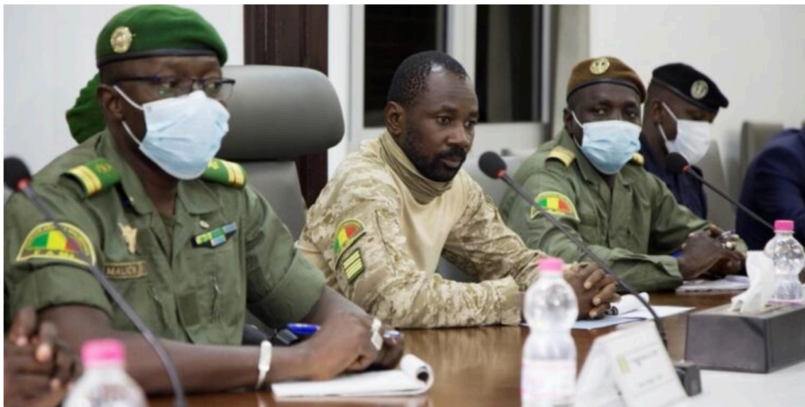
Mali's Transitional President, Colonel Assimi Goita (centre) flanked by leaders of the military government.