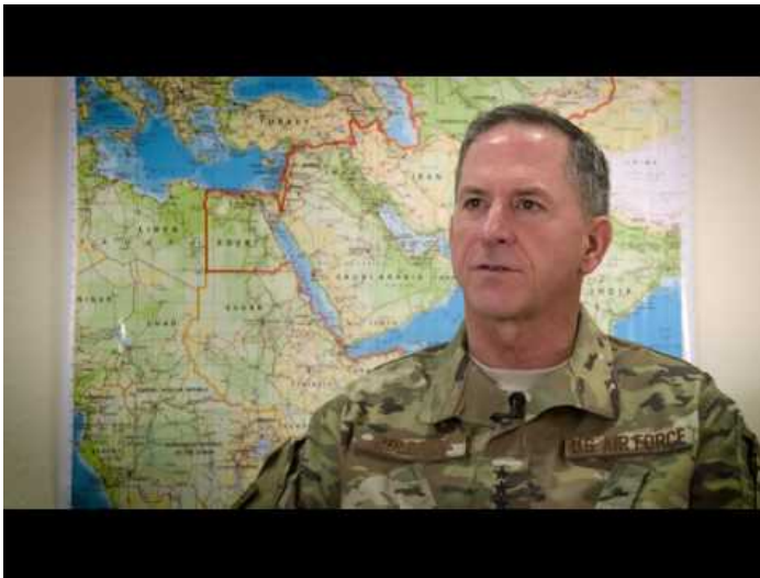
Le chef d'état-major de l'Aéronautique Dave Goldfein

Deux jours avant le test de missiles nord-coréen qui a déclenché l'alarme nucléaire dans le monde entier, est paru sur la revue Politico (12 mai) un article intitulé « Pourquoi les USA ont bien fait d'investir dans les armes nucléaires ». Signé non pas par un opinioniste, mais par les deux généraux qui sont au commandement des trois quarts des forces nucléaires étasuniennes : le chef d'état-major de l'Aéronautique, Dave Goldfein, et le chef du Commandement aérien pour l'attaque globale, Robin Rand.