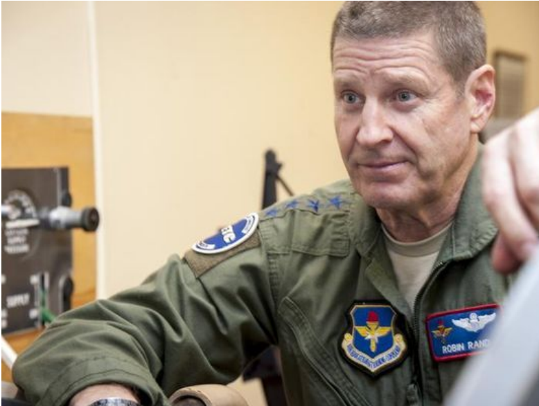
Le chef du Commandement aérien pour l'attaque globale, Robin Rand

Aujourd'hui les Etats-Unis doivent procéder à la modernisation de leurs propres forces nucléaires, parce qu'ils ont face à eux « des potentiels adversaires qui sont agressivement en train de moderniser et de répandre leurs forces nucléaires et qui veulent de plus en plus s'imposer ». Les généraux nomment « les menaces ouvertes de la Corée du Nord », mais il est clair qu'ils se réfèrent implicitement à la Russie et à la Chine. « Nos ennemis potentiels - préviennent-ils sur un ton menaçant- doivent savoir que notre direction nationale prendra toujours les dures décisions nécessaires pour protéger et assurer la survie du peuple américain et de ses alliés » : c'est-à-dire qu'elle est prête à faire la troisième guerre mondiale, la guerre nucléaire, à laquelle en réalité personne ne survivrait. Ils adressent ensuite une requête péremptoire à l'administration Trump : « Les Etats-Unis doivent maintenir leur engagement de recapitaliser nos forces nucléaires ».