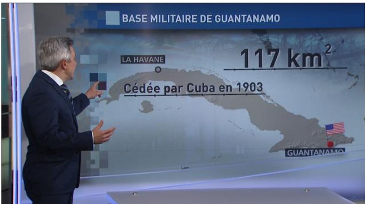
La base militaire de Guantanamo.

Le Southcom, qui couvre 31 pays et 16 territoires de l'Amérique latine et des Caraïbes, dispose de forces terrestres, navales et aériennes et du corps des marines, à quoi s'ajoutent des forces spéciales et trois spécifiques task force : la Joint Task Force Bravo, basée dans la base aérienne de Soto Cano au Honduras, qui organise des exercices multilatéraux et autres opérations ; la Joint Task Force Guantanamo, basée dans la base navale homonyme à Cuba, qui effectue des "opérations de détention et interrogatoire dans le cadre de la guerre au terrorisme" ; la Joint Interagency Task Force South, basée à Key West en Floride, avec la mission officielle de coordonner les "opérations anti-drogue" dans toute la région. L'activité croissante du Southcom indique que ce qu'a déclaré le président Trump le 11 août - " Nous avons de nombreuses options pour le Venezuela, y compris une possible action militaire" - n'est pas une simple menace verbale.