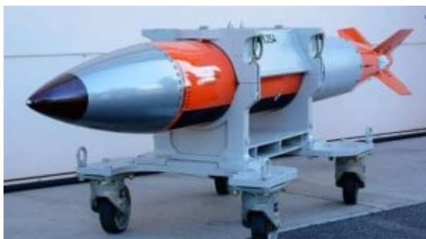
A B61-12 nuclear weapon

59. En cette période d'après-guerre froide, on ne semble plus se soucier de ce qu'implique une guerre nucléaire (destruction mutuelle assurée). Des documents militaires accessibles au public confirment qu'une guerre nucléaire préventive est toujours envisagée par le Pentagone. Comparativement aux années 1950, les armes nucléaires sont plus perfectionnées. Les vecteurs nucléaires sont plus précis.