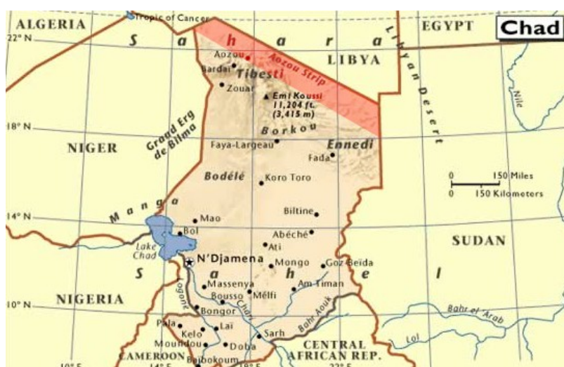
La bande d'Aozou, à la frontière tchado-libyenne

Le général Khalifa Haftar est un officier supérieur de l'armée libyenne qui a participé au coup d'état qui a mené Kadhafi au pouvoir en 1969 [13]. Principal officier dans le conflit armé Tchado-Libyen à propos de la bande frontalière d'Aozou (riche en uranium et d'autres métaux rares), il mena, sept ans durant, une guerre contre les troupes de Hissène Habré, ex-président tchadien soutenu par la CIA et les troupes françaises [14]. Aidés par les forces françaises, le Mossad israélien et la CIA, les Tchadiens infligèrent une sérieuse défaite aux troupes libyennes le 22 mars 1987, à Ouadi Doum (nord du Tchad) [15]. Haftar ainsi que ses hommes (un groupe de 600 à 700 soldats) sont capturés et emprisonnés. Désavoué par Kadhafi qui n'aurait pas du tout apprécié la défaite qui lui a fait finalement perdre la bande d'Aozou, le général a alors fait défection vers le FNSL [16].