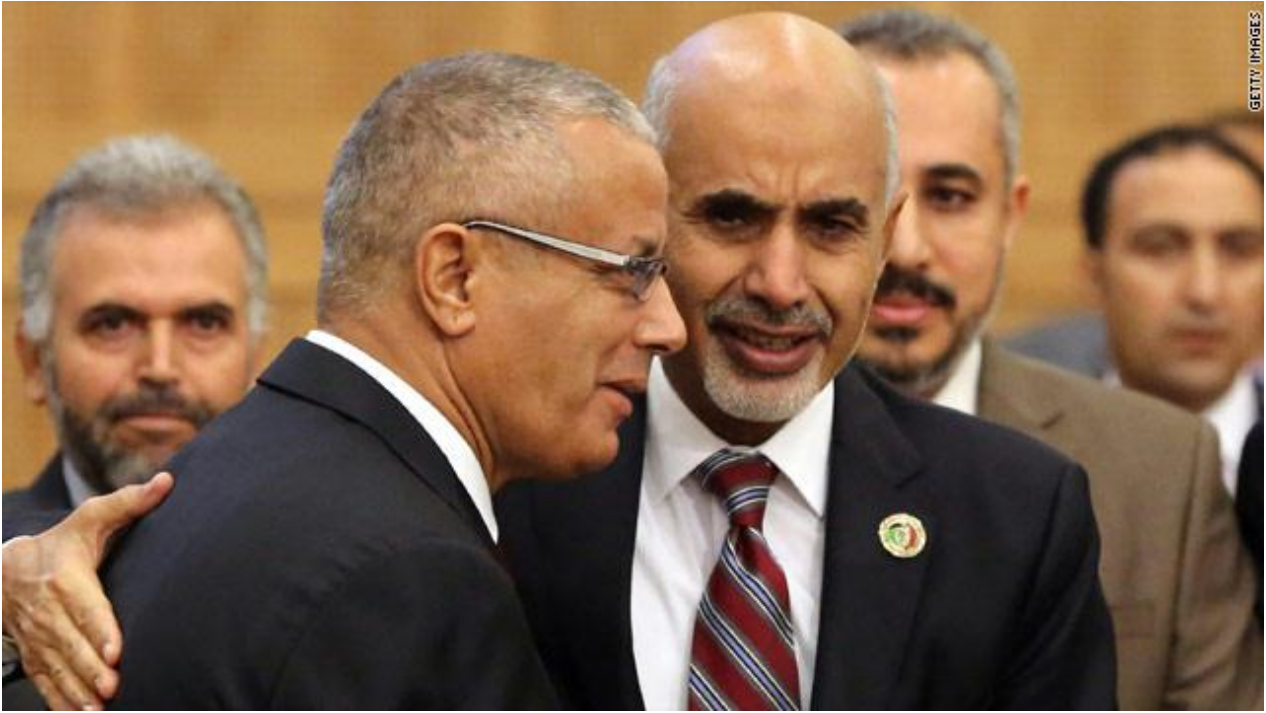
De gauche à droite au premier plan: Ali Zeidan et Mohamed Youssef El-Megaryef

La collusion entre Zeidan et l'administration américaine a été dénoncée après l'arrestation d'Abou Anas Al-Libi. En effet, l'ancien Premier ministre a été lui-même brièvement enlevé, le 10 octobre 2013, par un groupe d'anciens rebelles islamistes qui lui reprochaient d'avoir, quelques jours auparavant, collaboré avec le gouvernement américain dans l'arrestation d'Al-Libi, ex-membre d'Al Qaïda [10].