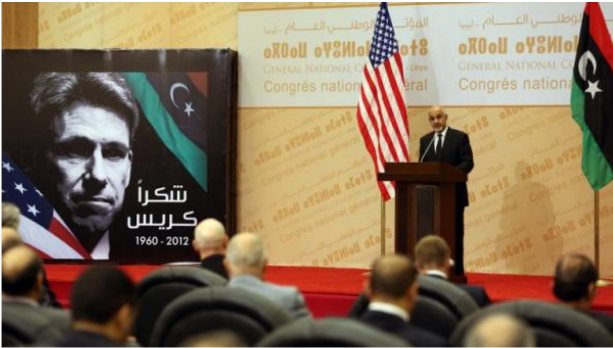
Le 20 septembre 2012: Mohamed Youssef El-Megaryef rendant hommage à l'ambassadeur Christopher Stevens et à trois autres Américains Sur la photo, en arabe: » Merci Chris »

Les interventions militaires ciblées, quant à elles, sont nécessaires pour la « neutralisation » de terroristes impliqués dans des agressions contre les intérêts américains comme ce fut le cas pour Abou Anas Al-Libi. En effet, le 5 octobre 2013, un commando américain l'a capturé en plein jour, dans un raid spectaculaire à Tripoli. Cet ex-leader islamiste, dont la tête était mise à prix pour 5 millions de dollars par le FBI, est accusé d'implication dans les attentats de 1998 contre les ambassades américaines en Tanzanie et au Kenya [4].