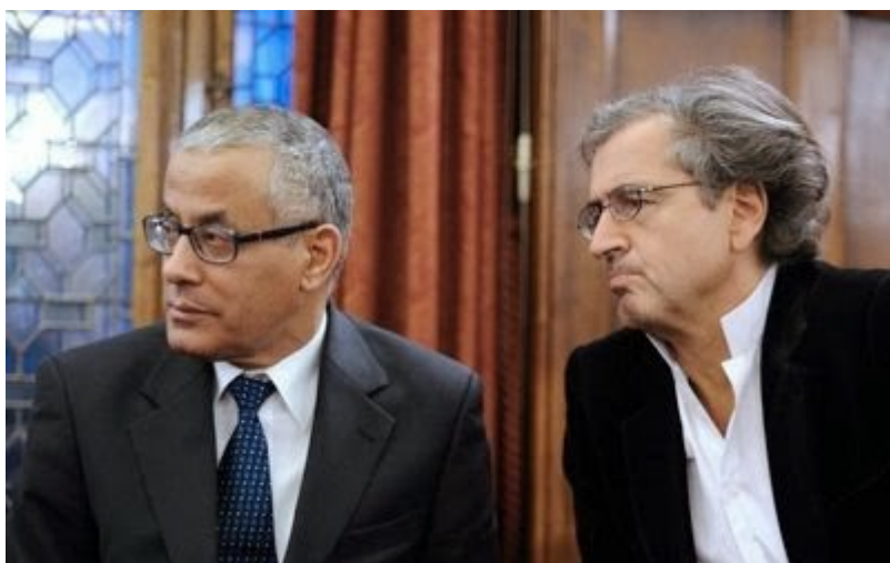
Ali Zeidan et Bernard-Henri Lévy, le 22 mars 2011 à l'hôtel Raphaël (Paris)

Curieuse situation, avouons-le, que celle de ce pays sensé être « printanisé » et démocratisé par la grâce des bombardements de l'OTAN et les « bons offices » d'un célèbre philosophe français, amateur de chemises blanches échanquées et friand de guerres « sans les aimer ».