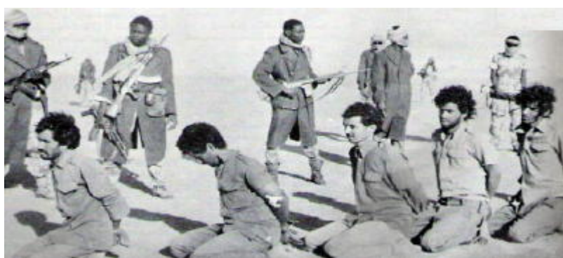
Prisonniers libyens durant le conflit tchado-libyen

Soutenu par le Tchad, la CIA et l'Arabie saoudite, il constitua alors, en 1988, l'Armée nationale libyenne, l'aile militaire du FNSL, pour tenter de renverser Kadhafi [17]. Un article du New York Times datant de 1991 nous apprend que les membres de cette armée « ont été formés par des agents de renseignement américains dans le sabotage et autres compétences de la guérilla, dans une base près de N'Djamena, la capitale tchadienne » [18].