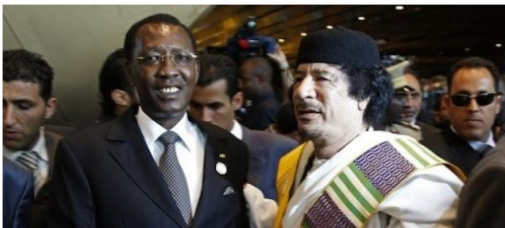
Idriss Déby et le colonel Kadhafi

complètement pour les rebelles libyens car le nouveau maître du Tchad était en bons termes avec Kadhafi. Cette bonne relation entre les deux hommes perdurera d'ailleurs jusqu'à la chute du leader libyen. En effet, Déby aurait même envoyé ses troupes pour le soutenir au début du « printemps » libyen [19].