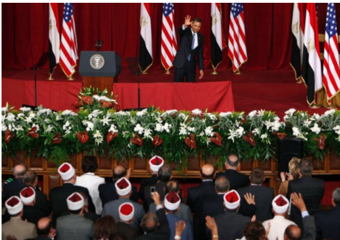
Obama et son fameux « discours du Caire » (Le Caire, le 4 juin 2009)

La politique étasunienne n'a décidément que des effets néfastes sur le monde arabe et ses institutions. L'action d'Obama a achevé ce qui restait de la « Ligue arabe », celle de Trump vient de provoquer une gigantesque lézarde dans les fondations du CGG (Conseil de coopération du Golfe).