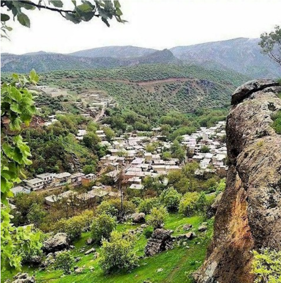
Le magnifique village de Quri Qaleh, près de Paveh (Province de Kermanshah, Iran)