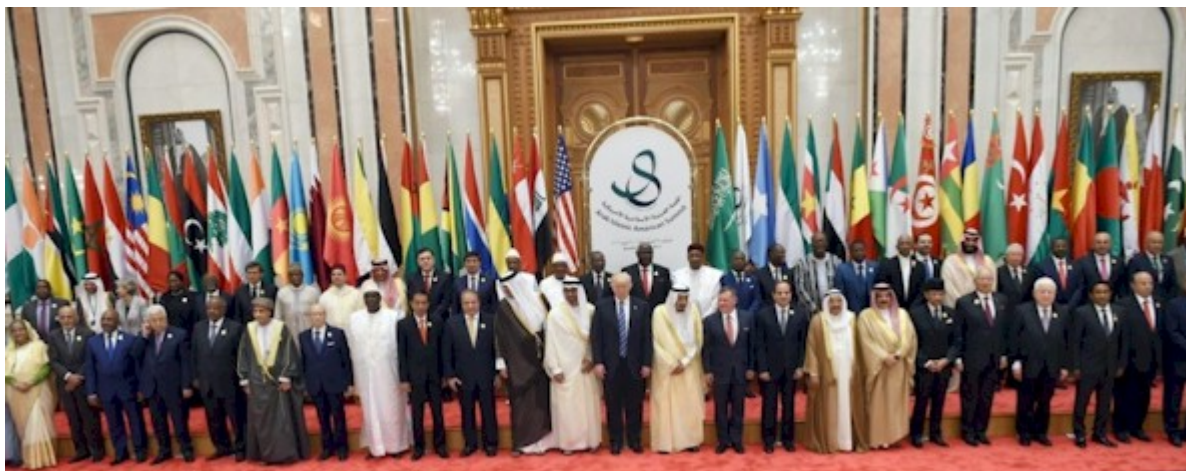
Trump et les dirigeants des pays musulmans (Riyad, le 21 mai 2017)

adressant au monde musulman son pompeux « discours du Caire » [20] . Nous connaissons malheureusement le résultat de son sermon démagogique, le mal nommé « printemps arabe » étant là pour nous le rappeler quotidiennement. La seule différence, certainement pas anodine, réside dans le choix du lieu. Obama a choisi la terre de la Confrérie des Frères musulmans alors que Trump a préféré celle du Wahhabisme.