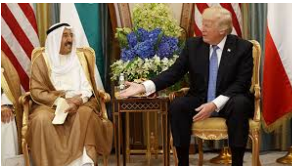
Donald « Ibn » Trump reçu en grande pompe chez les Al Saoud

Reçu royalement avec cavalerie, danse du sabre et grotesque collier en or, le président américain a traîné sa mèche rebelle dans les palais saoudiens, promené Mélanie et Ivanka cheveux dans le vent[11] et, évidemment, signé des contrats astronomiques, dont 110 milliards de dollars en vente d'armes pour contrer les « menaces iraniennes » (sic !)[12]. Un moyen comme un autre pour estomper les visées de la loi « JASTA » (Justice against Sponsors of Terrorism Act), votée sous la présidence Obama et qui ciblait tout particulièrement le royaume wahhabite[13].