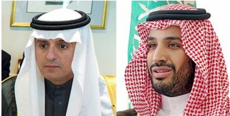
Adel Jubeir et Mohammed Ben Salmane

Cette poussée de témérité tartarinesque des Al Saoud a, comme par hasard, éclos juste après la visite du président Trump qui leur a réservé rien de moins que son premier voyage à l'étranger, une première dans l'histoire des États-Unis.