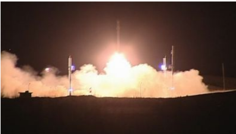
Lancement du 3 e satellite iranien, Navid-e Salm-o Sanat, le 3 février 2012