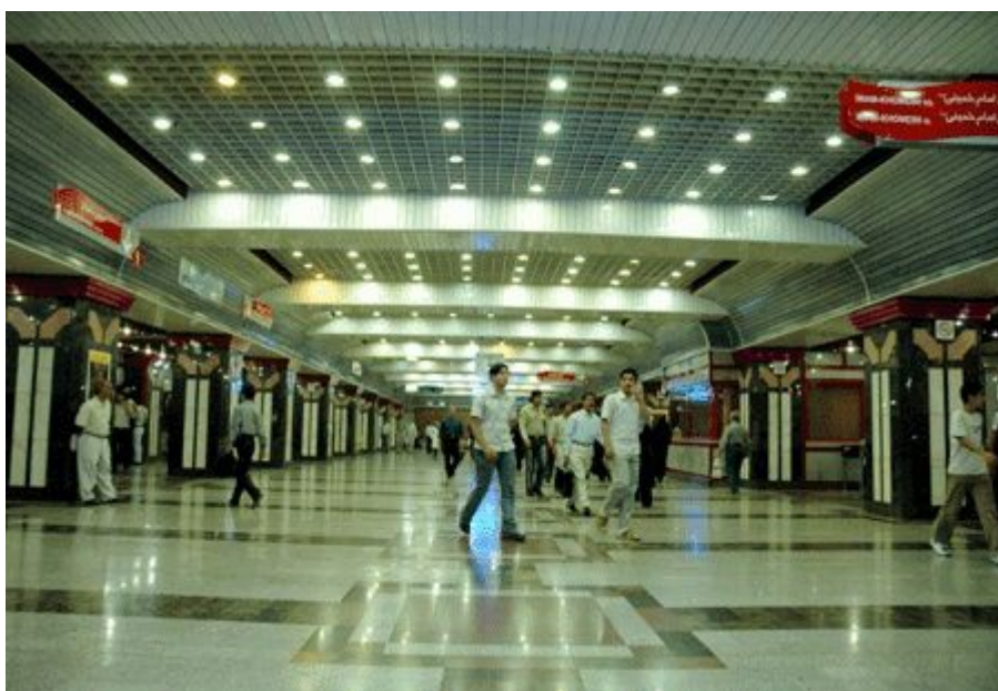
Métro de Téhéran