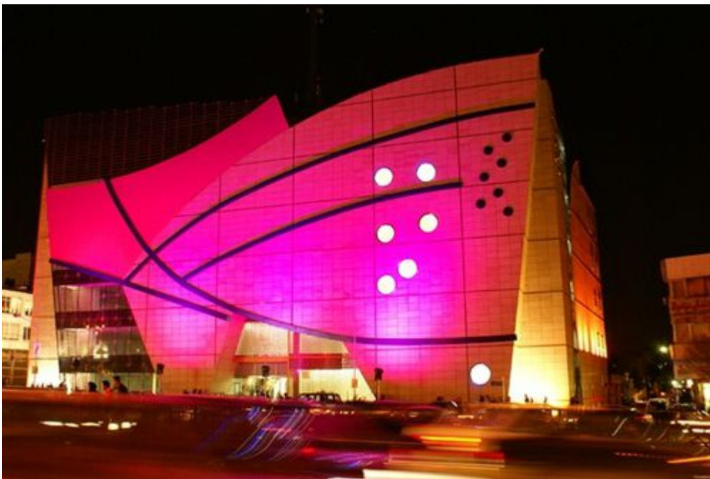
Haft-e Tir Square - Téhéran

étrangers (7)=> Eradication de la petite agriculture au profit des “cultures d’exportation” des grands propriétaires dont une majorité de sociétés étrangères (coton, agrumes, fleurs coupées, primeurs, etc.), accélérant l’exode rural et l’émigration illégale=> Eradication du petit commerce au profit de la grande distribution étrangère, avec incitation au surendettement dans la consommation=> Spéculation immobilière bloquant l’accession à la propriété ou au logement décent d’une grande partie de la population, tout en permettant aux occidentaux de se constituer un patrimoine immobilier de grande valeur (centres commerciaux, hôtels, résidences, terres agricoles, etc.) avec des prix et des avantages fiscaux meilleurs que chez eux=> Sous-traitance “paupérisante”, avec ses variantes les plus caricaturales : centres d’appel ou usines de confection de chemises et de jeans pour la grande distribution occidentale.Semi-esclavagisme, ancré sur des activités précaires (la moindre “crise” assèche immédiatement tourisme et sous-traitance), des fluctuations erratiques de cours des produits agricoles à l’export, ne créant ni emplois à forte valeur ajoutée, ni “essaimages” générateurs de développements techniques et scientifiques. Obligeant le pays à vivre dans l’endettement permanent, à la merci des exigences de ses créanciers occidentaux, au seuil de la survie. On peut, ainsi, le constater tristement pour ce grand pays, aux immenses talents et potentiels, qu’est l’Egypte