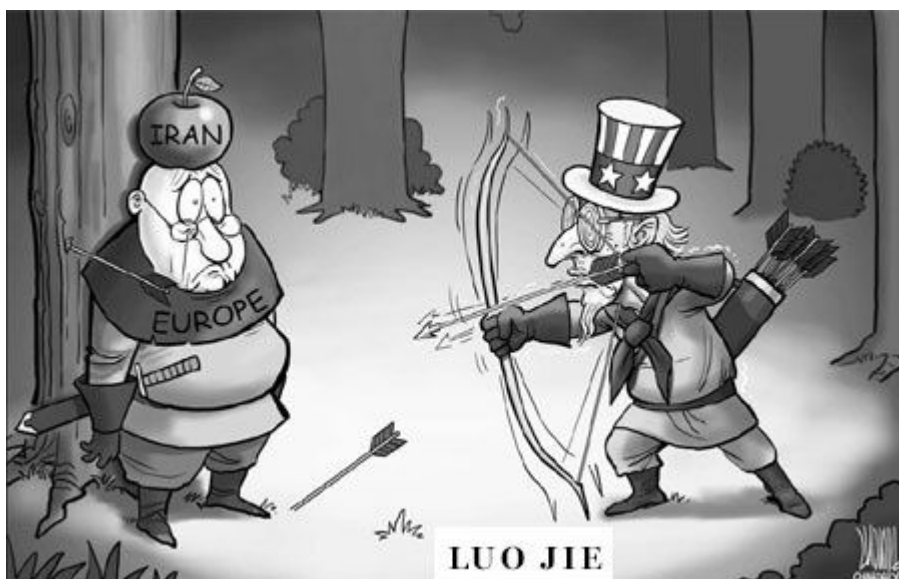
Caricature de LUO JIE - ChinaDaily - 19 janvier 2012

Chine et Russie, représentant un large courant de pays excédés des prétentions de la "Bande des Quatre" (USA, Israël, GB et France) associés aux pétromonarchies, bloquant pour la deuxième fois par leurs droits de veto au Conseil de Sécurité, les tentatives d'instrumentaliser l'ONU. La propagande de l'Empire et de l'Otan, leurs "agents d'influence" dont plusieurs occupent des postes gouvernementaux en Europe, se livrant à une séance d'histrionisme d'un cynisme absolu. Criant au scandale, exprimant leur "dégoût", stigmatisant "l'association des dictatures" contre la vertueuse "communauté internationale", dont ils s'autoproclament les porte-paroles. Leur ardeur charitable à l'égard du peuple Syrien trouvant sa limite dans l'oubli de la soixantaine de vetos émis rien que par les USA, entre 1972 et 2011 (14), verrouillant expressément toute intervention humanitaire contre massacres et spoliations infligés au Peuple Palestinien.