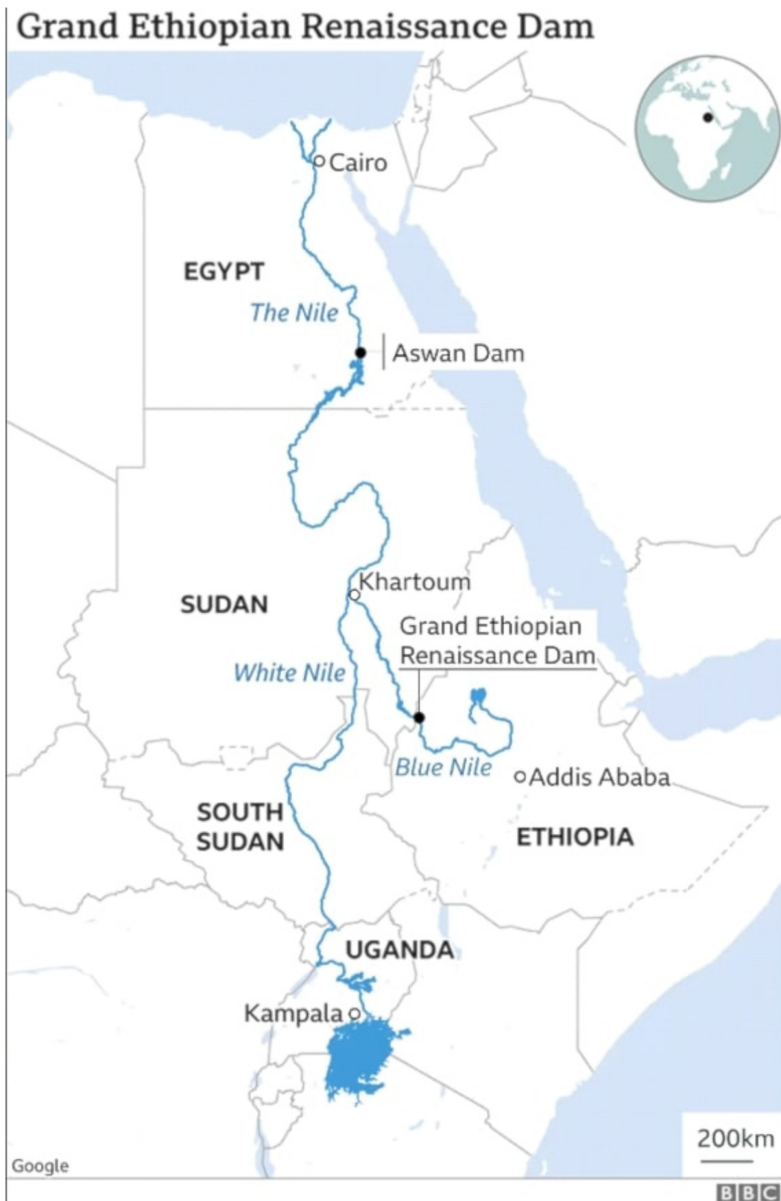
Le barrage de la Renaissance de l'Éthiopie, construit en 2011

L'Égypte souffre d'une grave pénurie d'eau depuis que son voisin, l'Éthiopie, a construit le barrage dit de la Renaissance en 2011, coupant l'eau du Nil dont le Soudan et l'Égypte ont tant besoin. Ce barrage est à l'origine d'un énorme différend qui n'a toujours pas été résolu.