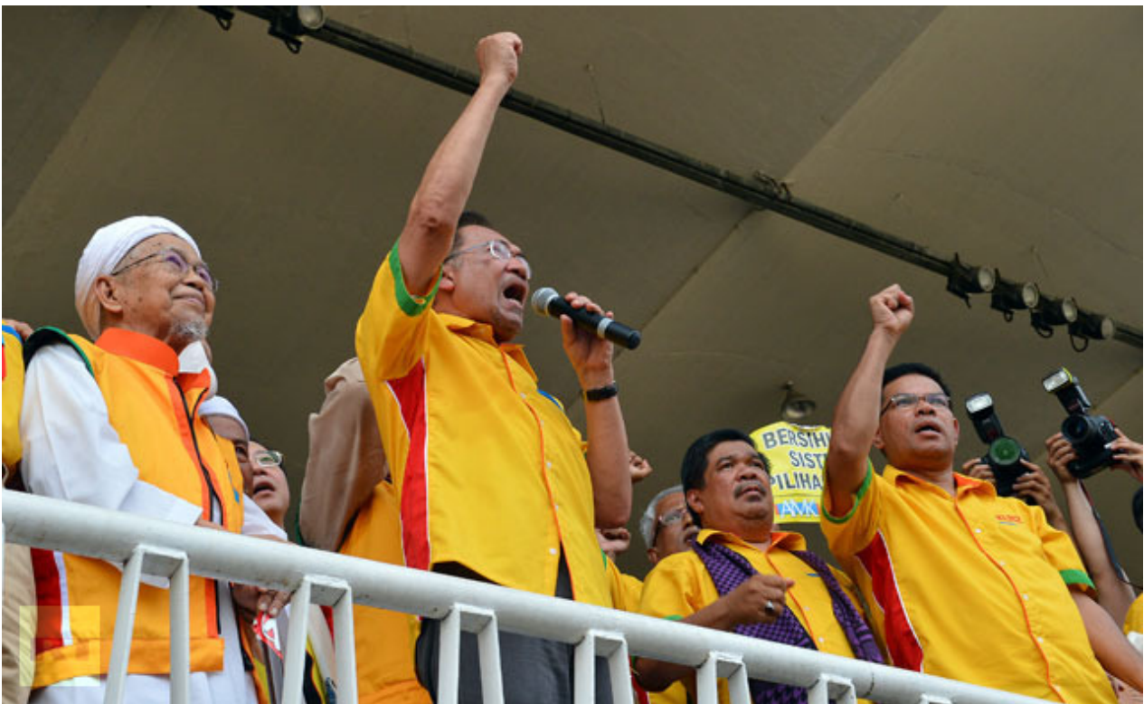
Malgré tous les efforts de Bersih pour se présenter comme apolitique, le mouvement est clairement dirigé par l'opposition soutenue par les Etats-Unis, dont le chef

« Il devait rencontrer le leader de l'opposition Anwar Ibrahim avec d'autres parlementaires australiens, ainsi que le ministre malais chargé des affaires parlementaires, Mr Mohamed Nazri, et des membres du groupe Bersih, la coalition pour des élections justes et en règle. »