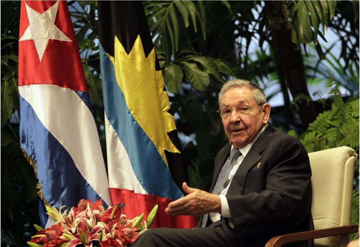
Presidente de Cuba, Raúl Castro recibió jefes de gobierno y de Estado en la isla

En un largo editorial, el New York Times exhortó a Washington a que cambiara de política y estableciera una relación más apaciguada con La Habana: