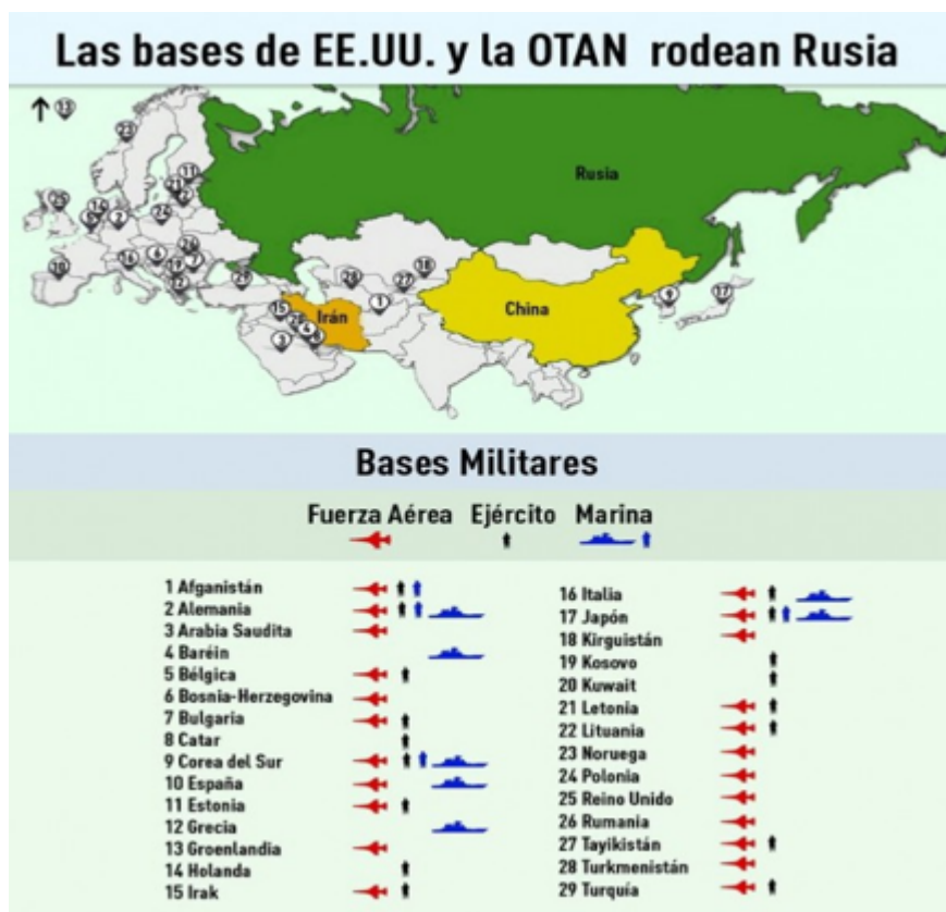
Figura 2. Las bases militares de los EE.UU. y la OTAN alrededor de Rusia

En la perspectiva de un progresivo aislamiento de Rusia la OTAN se ha involucrado en un intenso proceso de militarización de Europa del Este y tomando como pretexto el conflicto armado de Ucrania y la actitud agresiva de Moscú hacia Ucrania y Occidente. Todo este proceso ha continuado desde la anexión de Crimea a Rusia y se ha intensificado en los últimos meses. De hecho, la OTAN decidió, el 5 de febrero, « para fortalecer la defensa de su flanco oriental mediante la creación de una nueva fuerza de 5.000 hombres movilizados rápidamente y seis centros de mando en Europa del Este. Francia, Alemania, Italia, Polonia, España y el Reino Unido han aceptado ser los primeros países que participen en esta nueva fuerza llamada Punta de Lanza, que debería estar operativa en 2016.