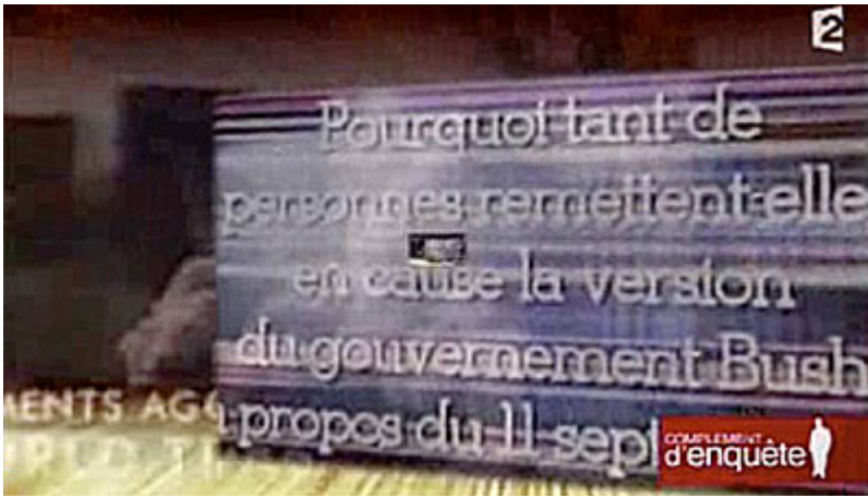
Image d'un clip invitant à s'informer sur les attentats du 11-Septembre ; trop rapide pour être vue (pas pour être perçue) ; NB : le commentaire audio affirme le contraire de ce que dit le message original.