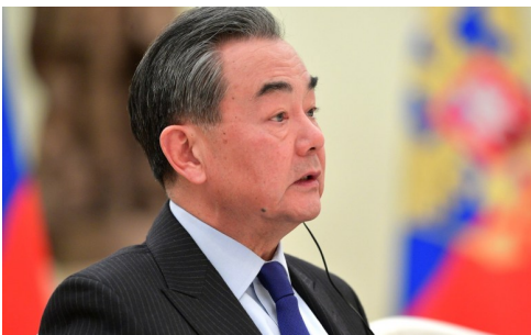
Le ministre chinois des Affaires étrangères, Wang Yi.

Il n'est donc pas surprenant que les diplomates de toute l'Asie du Sud-Est s'intéressent à la gouvernance mondiale et à l'entrée dans le « moment asiatique », comme le dit le ministre chinois des Affaires étrangères Wang Yi. C'est un moment qui pourrait durer un siècle, voire plus.