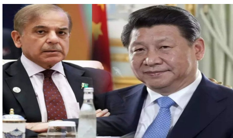
Le Premier ministre pakistanais Shehbaz Sharif en visite à Pékin.

Le Pakistan ne peut pas être laissé à l'implosion sous de sévères contraintes financières. Il n'est donc pas étonnant que Xi Jinping ait promis que « la Chine continuera à faire de son mieux pour aider le Pakistan à stabiliser sa situation financière ».