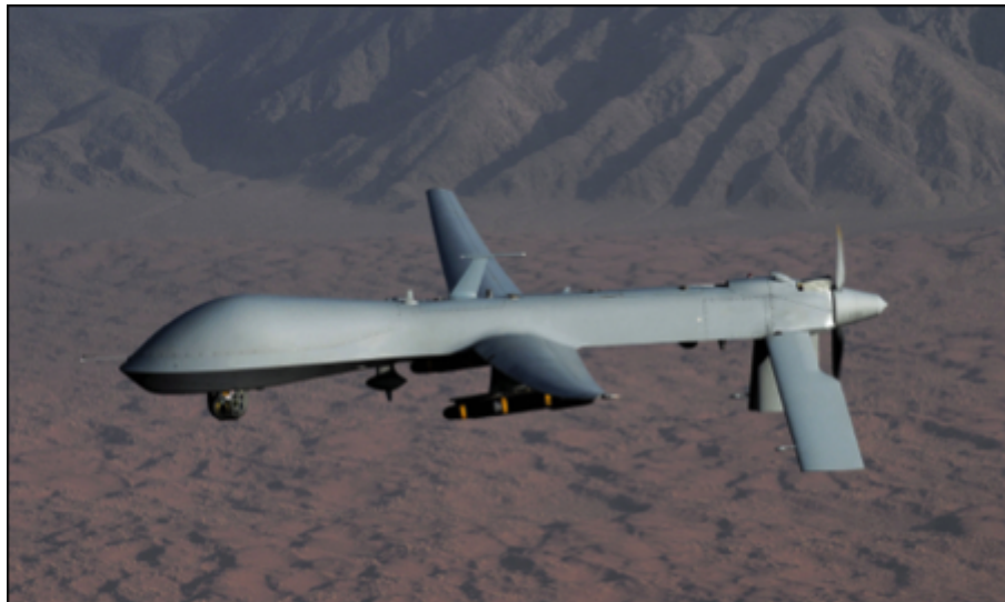
Figure 2. Le MQ-1 Predator. Un drone armé ou un Q drone