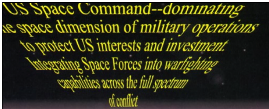
Figure 1. United States Space Command. Vision for 2020