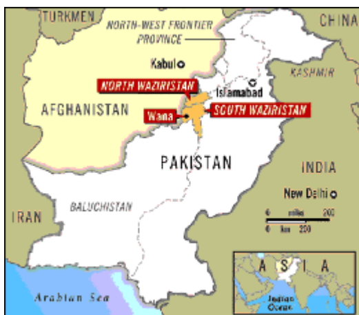
Figure 4. Localisation du Waziristan