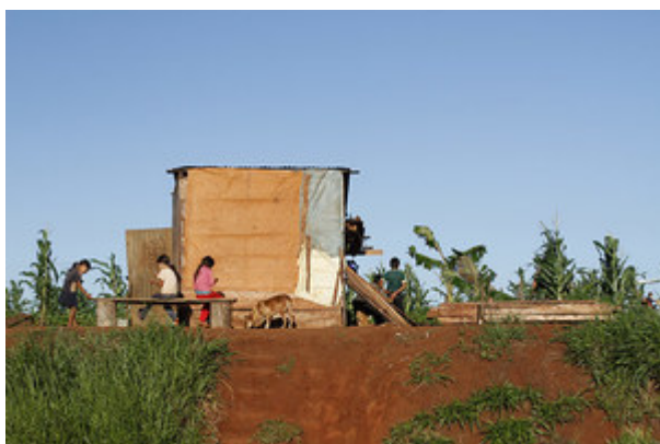
Caseríos precarios a la orilla de la carretera, ocupados por gente expulsada de su tierra por los monocultivos de soja en el Alto Paraná, Paraguay.