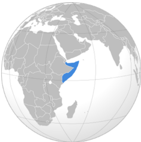
Figure 1. Localisation de la Somalie

Nous proposons, ici, de décrire la situation qui prévaut dans les pays les plus affectés tels que la Somalie, le Yémen et le Soudan du Sud. Nous exposons l'ampleur de cette crise et les effets des guerres qui en sont en grande partie à l'origine. Ce premier de trois articles est consacré à la Somalie (figure 1).