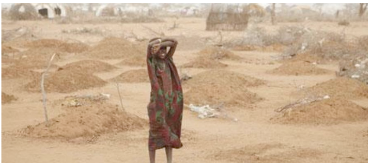
Figure 4. La famine en Somalie