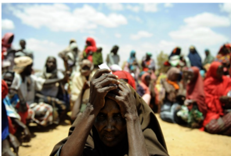
Figure 3. La famine frappe durement la Somalie depuis 2014

risques que la situation se dégrade vers une véritable famine se multiplient (figures 3 et 4). Le nombre de morts annoncés concerne la région de Bay seulement, qui est située dans le sud-ouest de la Somalie. La Somalie est l'un des quatre endroits ciblés par un plan d'aide des Nations unies d'une valeur de 4,4 milliards de dollars américains lancé en février par le secrétaire général de l'ONU pour éviter une famine généralisée. Les autres pays soutenus sont le Nigeria, le Soudan du Sud et le Yémen, toutes des nations qui sont aussi bouleversées par de violents conflits. Environ 353 000 enfants souffrant de malnutrition « ont besoin de traitements et de soutien nutritionnel urgents », selon le système d'avertissement de risques de famines du réseau américain Agency for International Development » ( Radio-Canada ).