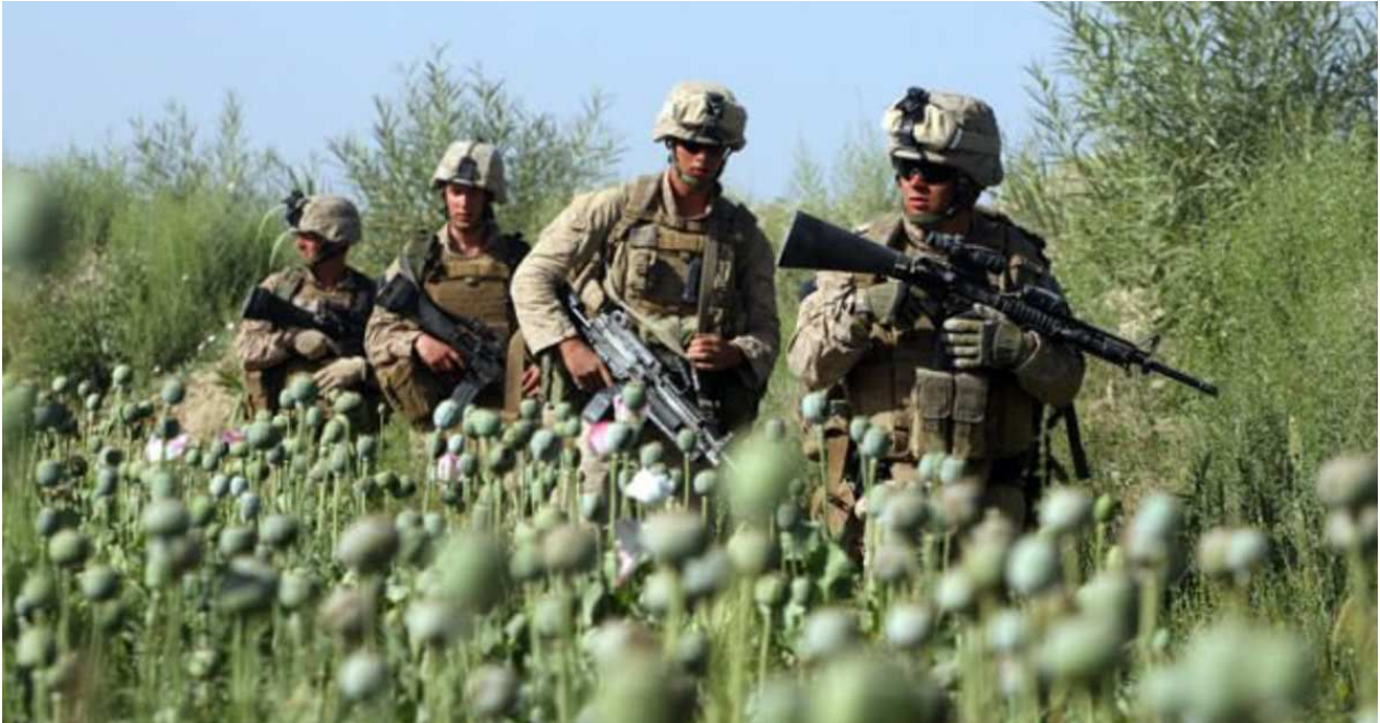
Soldats américains dans un champ de pavot en Afghanistan

Nous ne devons pas oublier que la production d'opium a connu une forte hausse dans l'immédiat après l'invasion américaine en octobre 2001.