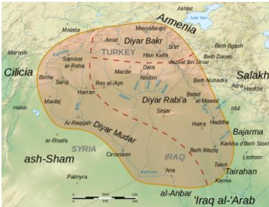
Haute Mésopotamie, al Jazera, env. 80 avant JC

Une telle entité américaine d'occupation dans la Jazira :