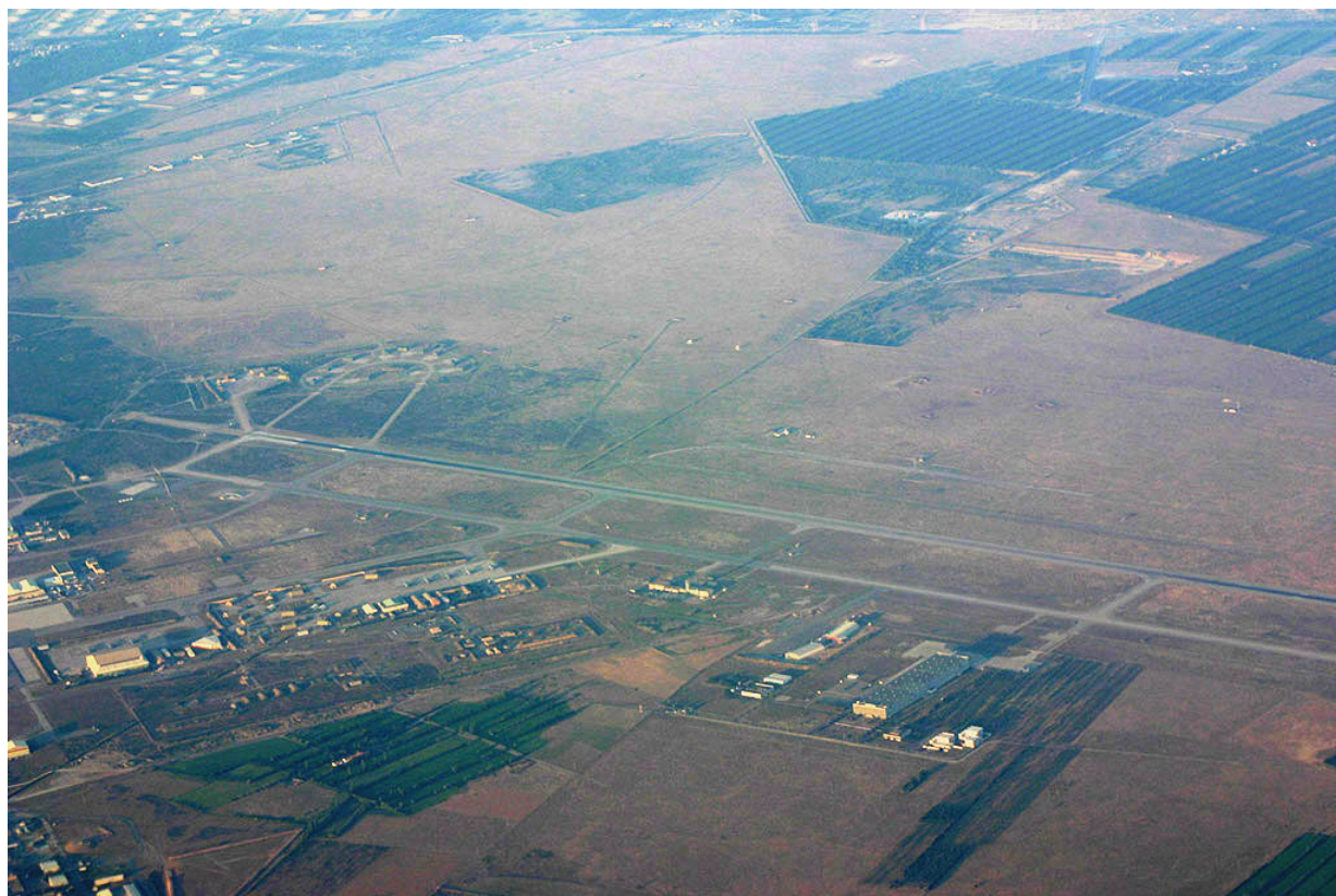
La base militaire d'Istres

KC-135 pour l'approvisionnement en vol des chasseurs-bombardiers français. L'opération n'est pas dirigée seulement vers la Libye. Istres est la base de l' «opération Barkhane », que la France conduit avec 3mille militaires en Mauritanie, Mali, Niger, Tchad et Burkina-Fasso.