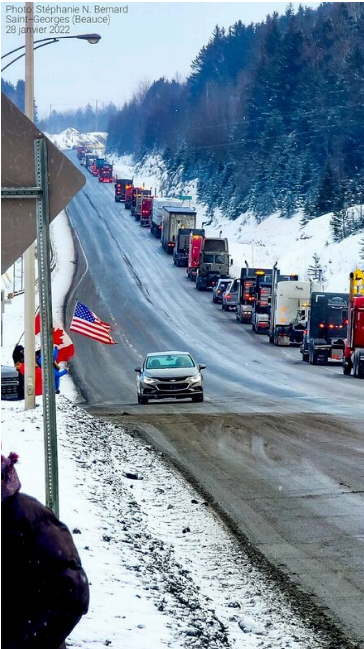
© Stéphanie N. Bernard St-Georges de Beauce

Photo: Stéphanie N. Bernard Saint-Georges (Beauce) 28 janvier 2022