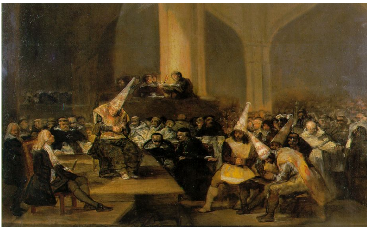
Francisco Goya : L'Inquisition espagnole (1812-1819) Real Academia de Bellas Artes de San Fernando, Madrid