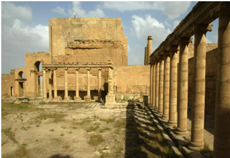
Figure 3. Grande cité d'Hadra

romaine se combine avec des éléments de décor d'origine orientale, témoignent de la grandeur de sa civilisation» ( http://whc.unesco.org/fr/list/277 ). Cette cité, vieille de 2 000 ans, est située dans la province de Ninive, à 110 km au sud de Mossoul (figure 3). ( http://whc.unesco.org/fr/list/277 ). L'évaluation des dommages infligés à la cité n'a pas encore été faite étant donné que le site se situe dans un territoire encore contrôlé par l'EI.