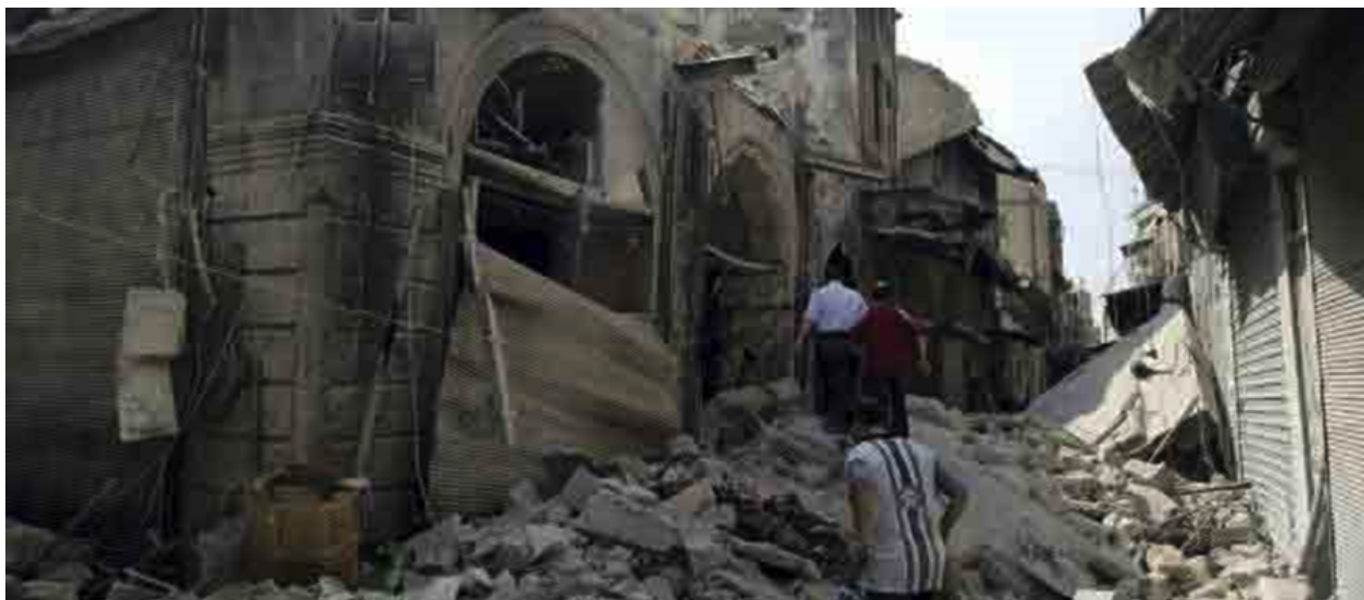
Figure 1. Une ruelle du souk d'Alep en Syrie détruite par la guerre. Un site du patrimoine mondial en péril