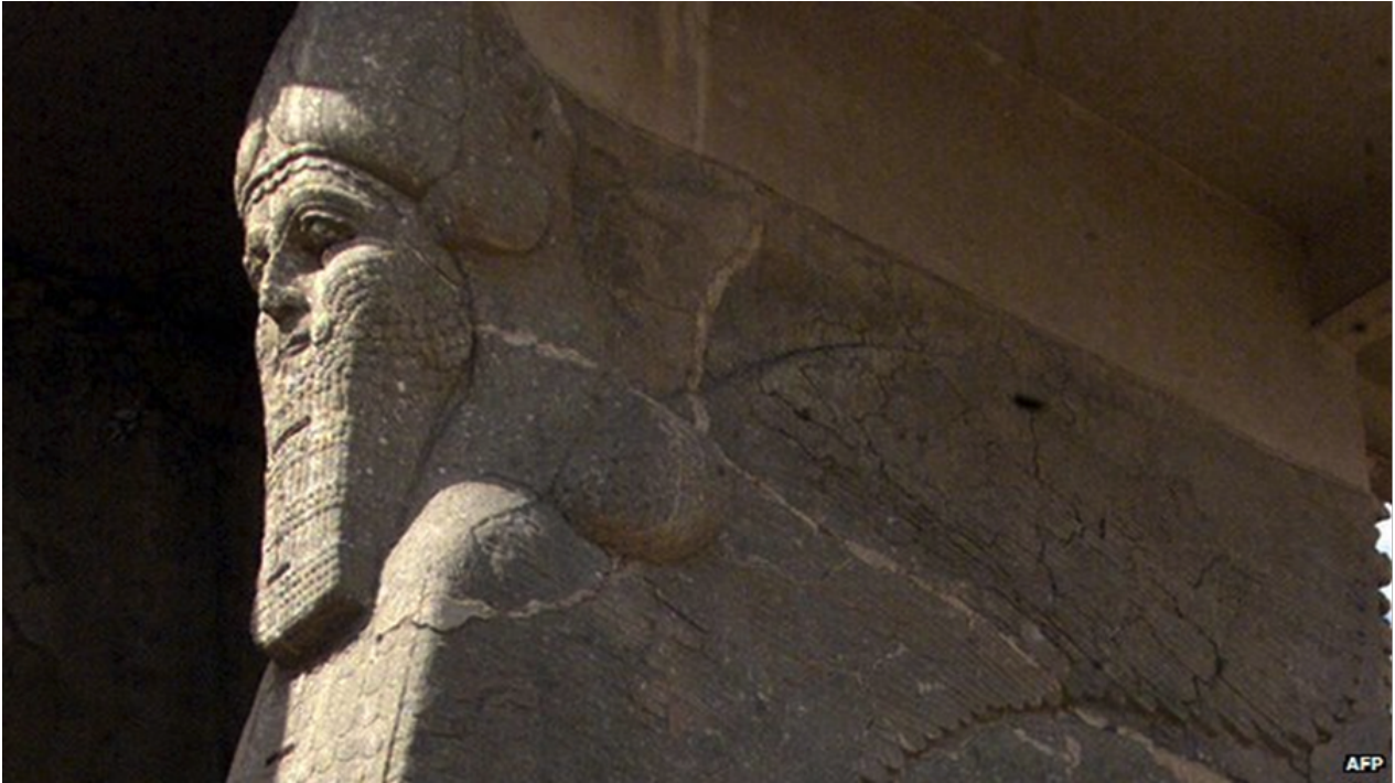
Figure 8. Un Lamassu, taurau à figure humaine

Source : http://www.bbc.com/news/world-middle-east-31760656