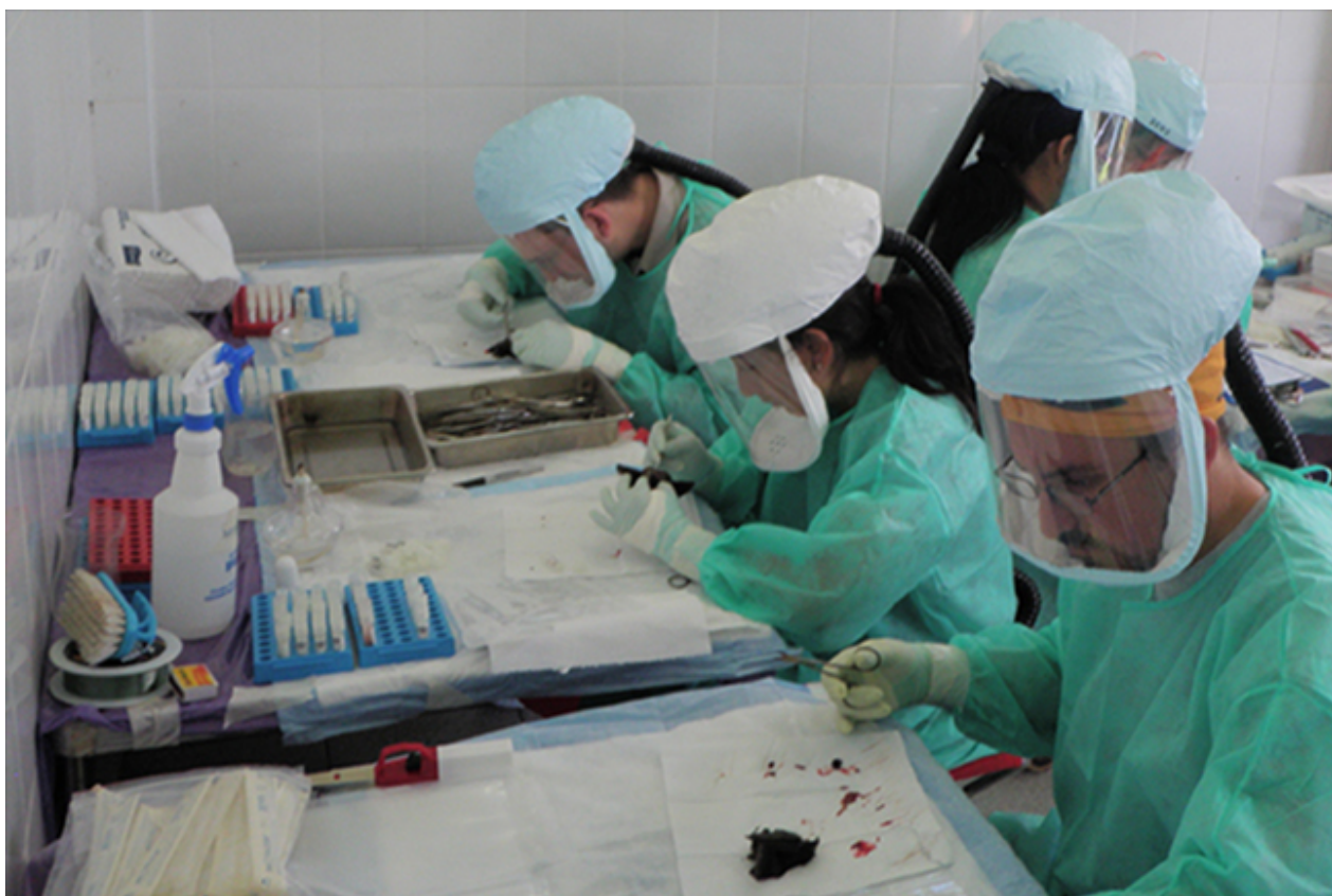
NAMRU-6, Iquitos, Pérou.