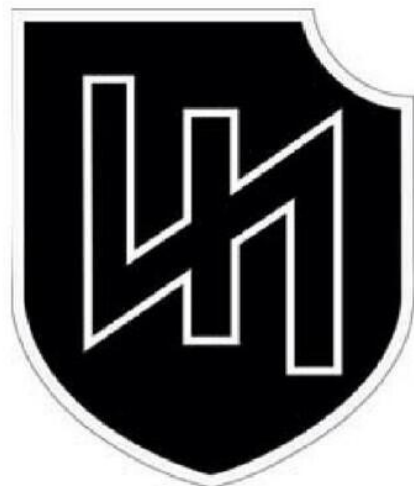
Emblema da Divisão SS Das Reich.

Ces milices portant l’emblème nazi des SS sont parrainées par le ministère ukrainien des Affaires intérieures, ce qui équivaut au département de la Sécurité intérieure des États-Unis (Homeland Security).