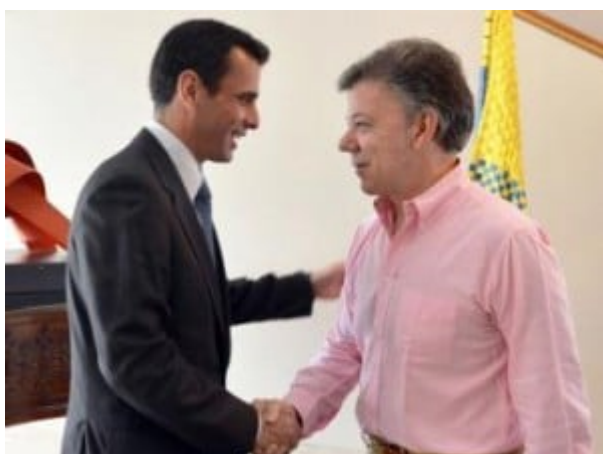
Capriles et Santos

« Dès l'annonce de Capriles, des groupuscules néofascistes déferlent dans les rues du pays. Des symboles du chavisme sont détruits, des militants attaqués et assassinés, des petits commerces sont saccagés et brûlés. On dénombre 7 morts et 61 blessés, par balle pour la plupart. Cinq sièges régionaux du Parti socialiste Uni du Venezuela (Psuv) sont dévastés par les flammes, tout comme douze cliniques populaires où officient des médecins cubains. »