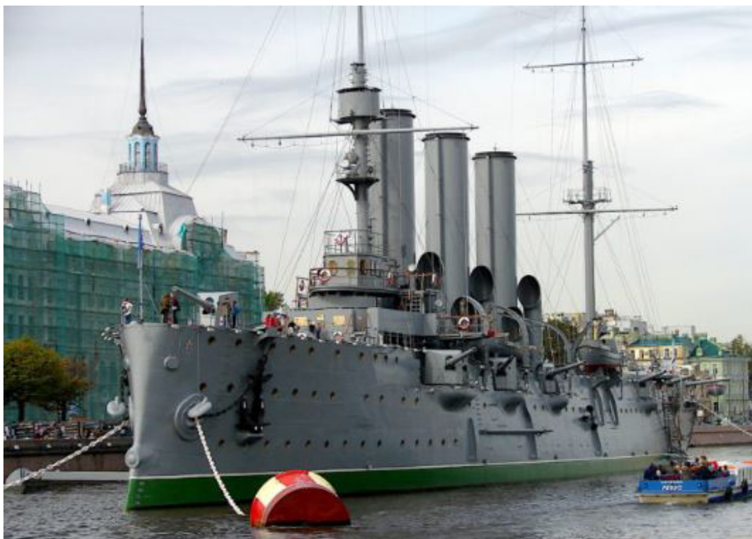
Xi et Poutine en croisière dans un monde multipolaire : le Musée Aurora Cruiser

l'environnement » ; la Chine « mettra en œuvre l'accord de Paris sur le climat » ; et la Chine « est prête à partager la technologie 5G avec tous les partenaires » sur la voie d'un changement crucial dans le modèle de croissance économique.