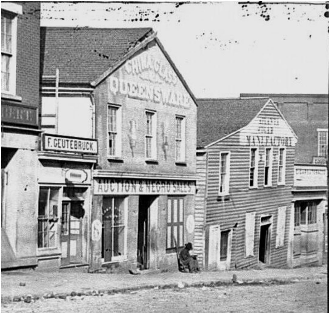
« Enchères et vente de noirs », Atlanta, Géorgie. http://www.historyplace.com/civilwar/cwar-pix/auction.jpg