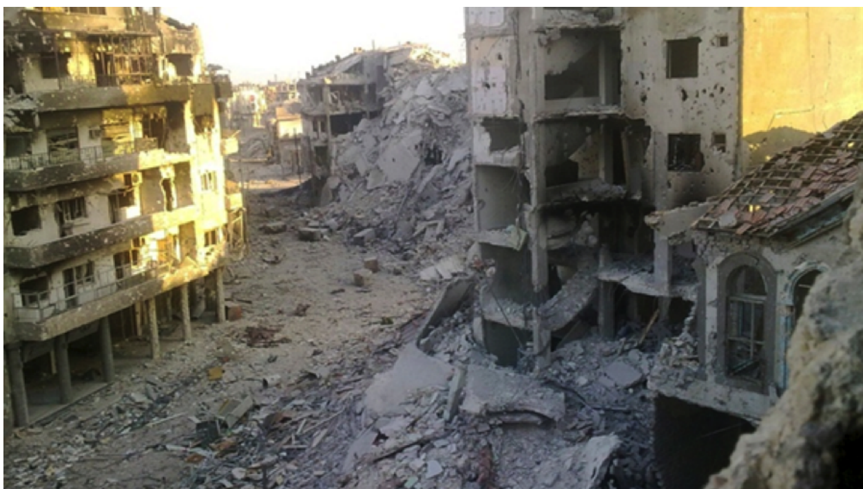
Figure 3. Vue d'un quartier de Homs détruit par les bombardements