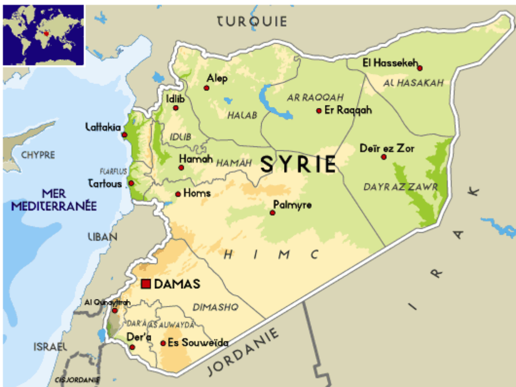
Figure 1. Carte politique de la Syrie avant la guerre