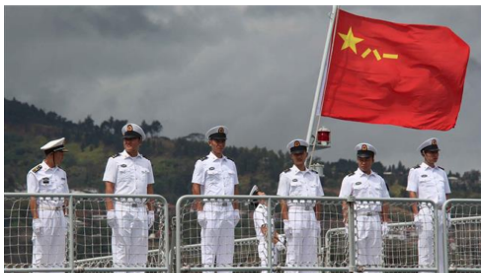
Figure 1. La marine chinoise augmente ses effectifs