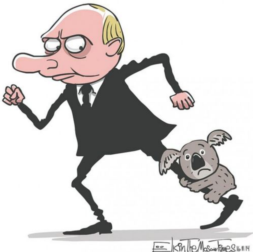
Le Koala, symbole de la bouffonnerie des Occidentaux au G20 de Brisbane, accroché à la jambe de Poutine

De tout cela, il ressort au moins quelque chose de positif : de façon limpide et sans équivoque, cela montre à quel point les élites occidentales détestent la Russie, à tel point que cette haine éclipse toute autre considération ou valeur.