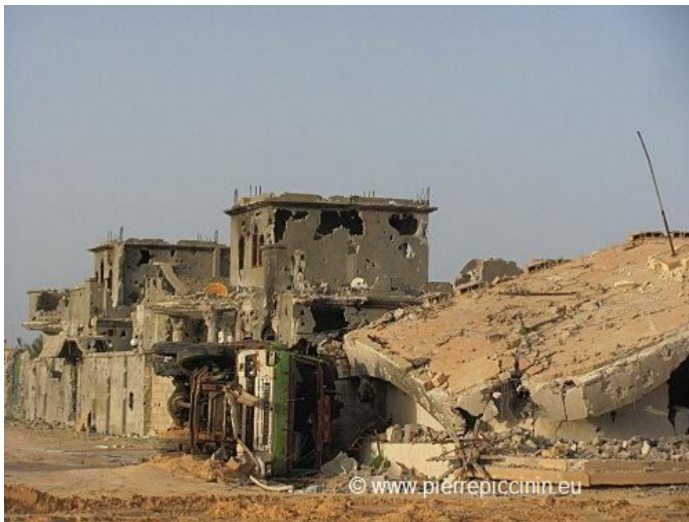
Syrte (© photo Pierre PICCININ - octobre 2011)

L'objectif du CNT serait donc d'éviter que ces clans hostiles ne se reconstituent et ne reprennent tôt ou tard les combats pour venger leurs morts et se libérer de la tutelle de leurs vainqueurs.