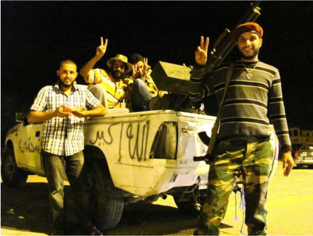
Check-point à Sabratha