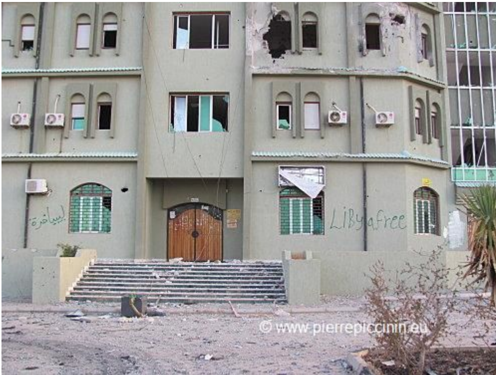
Beni Oualid