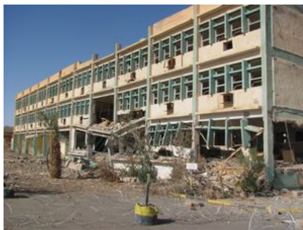
Le gouvernorat et la station d'autobus de Sebha (© photo Pierre PICCININ - novembre 2011)

Parfaitement ciblée, d'une manière réellement « chirurgicale », la station d'autobus a été détruite, car elle servait de plateforme pour le transport des contingents de mercenaires envoyés en renfort de Sebha à Tripoli. Sur la route qui quitte la ville en direction du nord, plusieurs carcasses d'autocars détruits par les appareils de l'alliance atlantique témoignent des convois de troupes qui sont partis de Sebha pour la Tripolitaine.