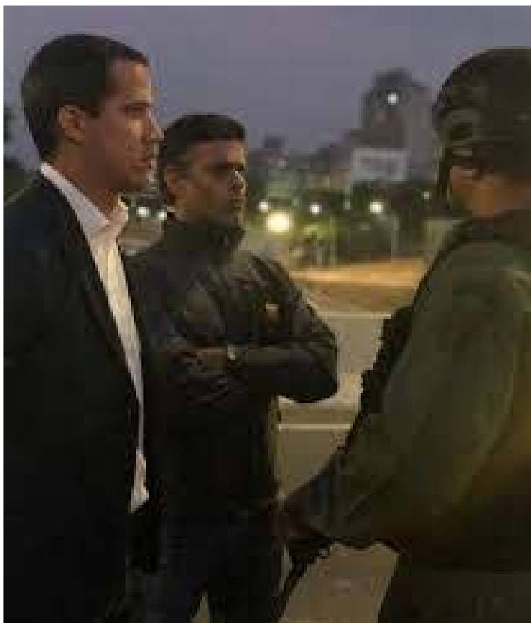
Leopoldo López et son subordonné Juan Guaido lors du coup d'État manqué d'avril 2019 à Caracas