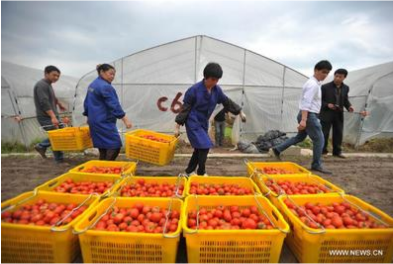
Des agriculteurs mettent des tomates en caisse dans le village de Guandao, en Chine du sud-ouest, pendant la récolte de printemps de 2014.

Les investissements chinois à l'étranger, et la BRI en particulier, laissent peu à peu entrevoir un certain nombre de problèmes : endettement et menaces pour la souveraineté nationale, accaparement de terres, déplacement, violations des droits humains dans les zones de conflit, conséquences environnementales, préoccupations de santé publique et violations du droit du travail.