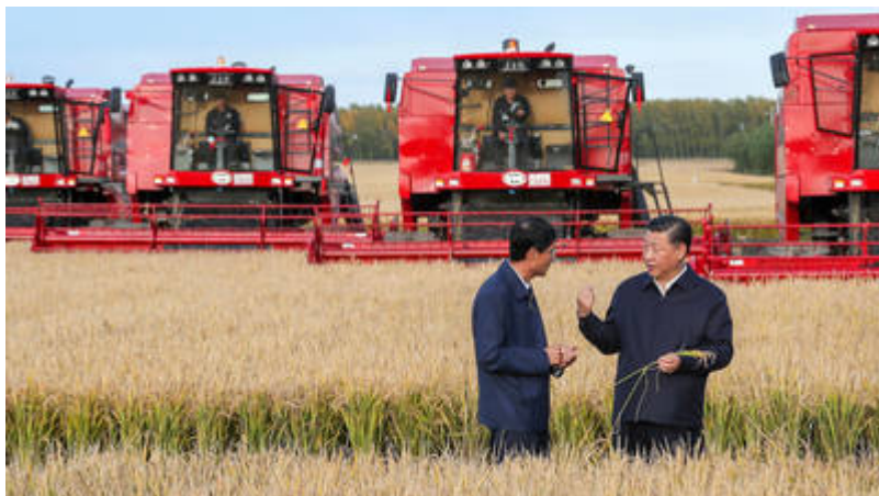
Visite du Président chinois Xi Jinping dans la province du Heilongjiang, en Chine, septembre 2018.

L'Afrique de l'Est est le premier lien dans la connexion de la BRI à l'Afrique. La Chine construit des ports et des infrastructures maritimes pour améliorer la route menant de l'Asie du Sud au Kenya et à la Tanzanie, puis jusqu'à la Méditerranée via Djibouti. Des voies ferrées intérieures sont également en construction. La Chine a notamment promis de combiner la BRI avec l'ancien Forum pour la coopération Chine-Afrique, pour booster la productivité agricole africaine et accroître les importations de produits agricoles de l'Afrique vers la Chine.[10] La Chine dispose déjà de parcs agro-industriels au Mozambique, en Ouganda, en Zambie et dans d'autres pays et étend aujourd'hui ses investissements agro-industriels sous la bannière de la BRI.