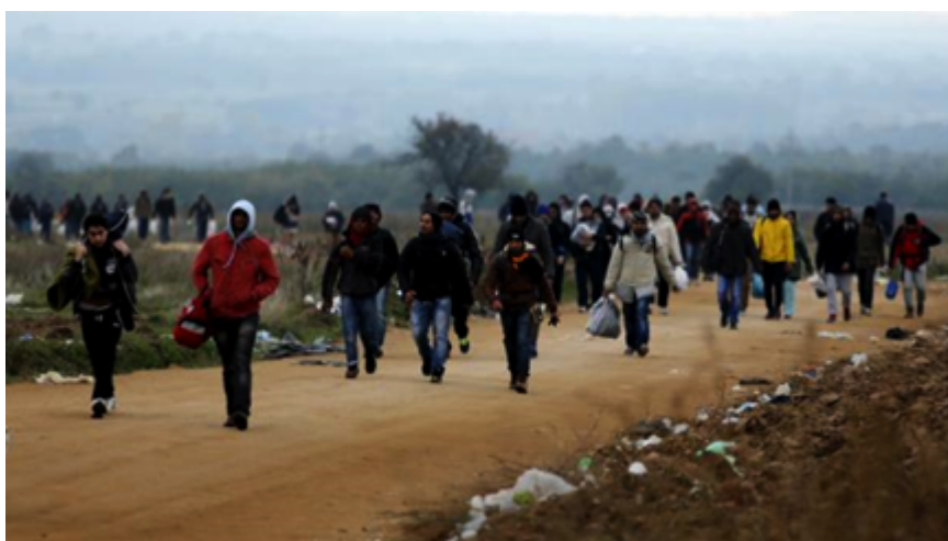
Figure 3. Des réfugiés marchent dans la campagne serbe, dans les environs de Miratovac, en venant de Macédoine, le 24 octobre 2015