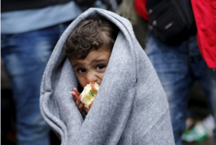
Figure 5. Un enfant mange une pomme en attendant de traverser la frontière pour entrer en Croatie, en octobre 2015.