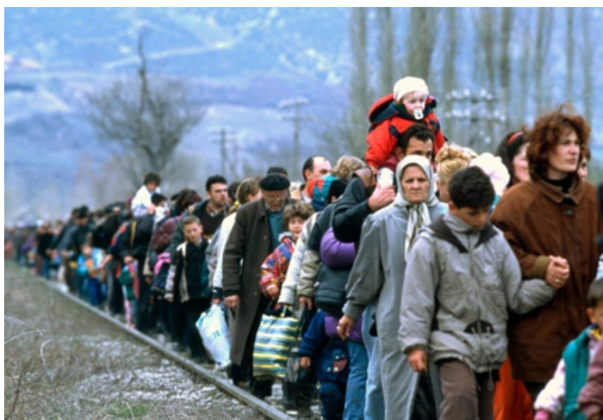
Figure 4. Les réfugiés en route vers la Hongrie

traversée du territoire turc, la traversée de la Grèce en joignant les îles et en trouvant un transport jusqu'au Port du Pirée, puis la traversée de la Macédoine et de la Serbie pour se buter au mur frontalier qu'a édifié la Hongrie pour contrôler cette « invasion » de l'espace Schengen. Le séjour des réfugiés en Hongrie a été un cauchemar : Un accueil froid, des conditions d'hébergement précaires, un blocage systématique de tout mouvement par train vers l'Autriche et l'Allemagne, bref un traitement condamné partout dans le monde et amenant les réfugiés à entreprendre à pied la distance de 175 km entre Budapest et la frontière austro-hongroise. Le sort réservé aux réfugiés cheminant sur la route des Balkans s'est avéré celui du chef de gouvernement hongrois, Victor Orban, qui s'est autoproclamé défenseur de l'intégrité de l'espace Schengen. Il a déclaré que « le problème des migrants n'était pas celui de l'Europe, mais celui de l'Allemagne ». Comment peut-on concevoir qu'un pays qui a subi les affres du nazisme puisse traiter ainsi des populations affamées, épuisées et malades et de les enjoindre de poursuivre à pied leur route sans réconfort et sans aide? Il y a là un comportement franchement fasciste (Jules Dufour, La longue marche des réfugiés vers l'Europe: Des milliers de déplacés fuient les guerres USA-OTAN. Mondialisation.ca , 7 septembre 2015).