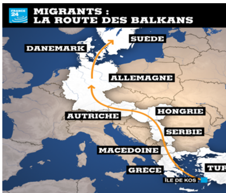
Figure 2. La route des Balkans

https://fr.wikipedia.org/wiki/Crise_migratoire_en_Europe#/media/File:Map_of_the_European_Migrant_Crisis_2015.png