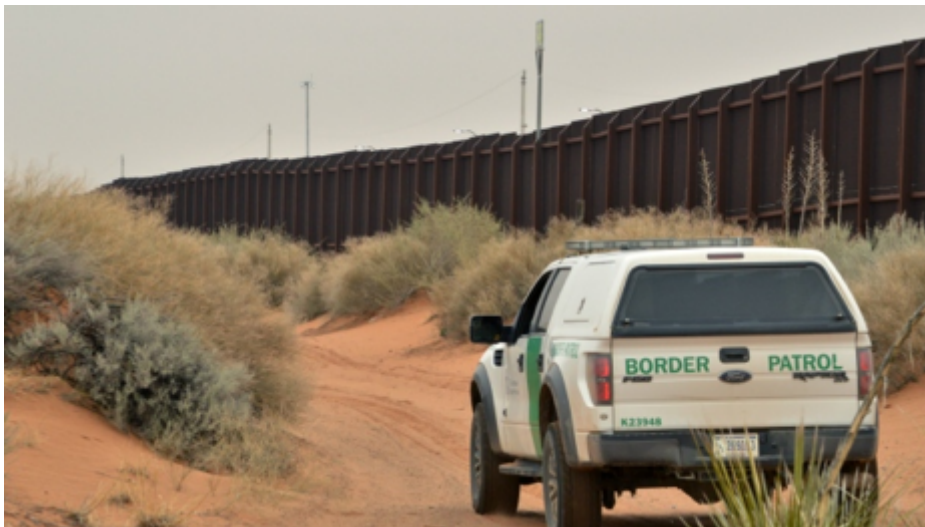
Figure 3. Le Mur et la patrouille de surveillance

: http://www.sudouest.fr/2017/01/12/le-mexique-assure-qu-il-ne-paiera-pas-le-mur-de-donald-trump-3098414-4803.php