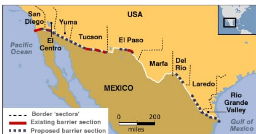
Carte des barrières construites depuis les années 90.