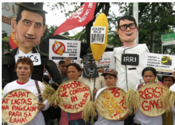
Les paysans s'opposent au riz doré car ils savent que ce riz ne rend aucun service aux agriculteurs ni aux consommateurs, et qu'il s'agit plutôt d'une façon