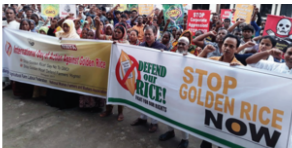
Action de solidarité mondiale contre la commercialisation du riz doré au Bangladesh.

Le Bangladesh a terminé les essais au champ en milieu confiné du riz doré de l'Institut de recherche sur le riz du Bangladesh (BRRI), situé à Gazipur, au début de 2017. Il est actuellement sur le point de soumettre au ministère de l'Environnement et au ministère de l'Agriculture une demande d'essai au champ sur plusieurs sites, dans des champs d'agriculteurs. Par ailleurs, une demande d'évaluation environnementale et de sécurité