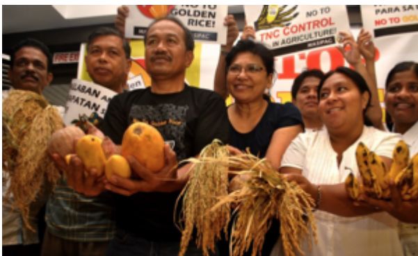
Des agriculteurs et des leaders montrent des sources naturelles de Vitamine A que l'on peut trouver en Asie.