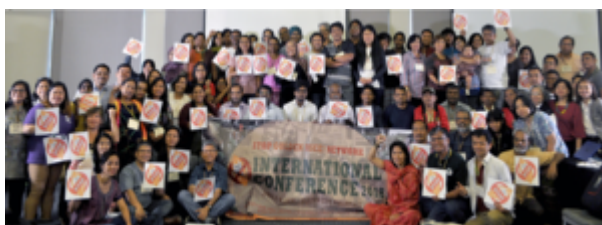
Des délégués internationaux d'Inde, Sri Lanka, Bangladesh, Chine, Vietnam, Indonésie, Australie, Nouvelle-Zélande et Canada ont participé à la Conférence internationale du Réseau Stop! Golden Rice, du 2 au 4 avril 2018.

L'Inde participe au développement du riz doré depuis le tout début. Le Dr Potrykus a lui-même reconnu avoir reçu le soutien de la Collaboration indo-suisse en biotechnologie (ETH Zurich), une institution financée conjointement par le Département indien des biotechnologies à New Delhi (Inde) et l'Agence suisse pour le développement à Berne (Suisse). Le riz doré a été introduit en Inde grâce au cadre organisationnel existant de la Collaboration indo-suisse en biotechnologie, et il était initialement prévu que l'Inde joue un rôle de premier plan et serve de modèle à d'autres pays.