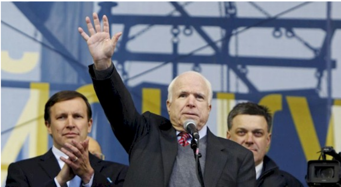
John Mc Cain (Euromaïdan, Kiev, 15 décembre 2013)

Pour rafraichir la mémoire des lecteurs, il est nécessaire de rappeler certains faits. Jusqu'à l'année de son décès, en 2018, le sénateur John McCain a été président de l'IRI. Son rôle dans le coup d'État de l'Euromaïdan (Ukraine) et dans le « printemps » arabe n'est plus à démontrer.