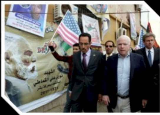
Libye, 22 avril 2011