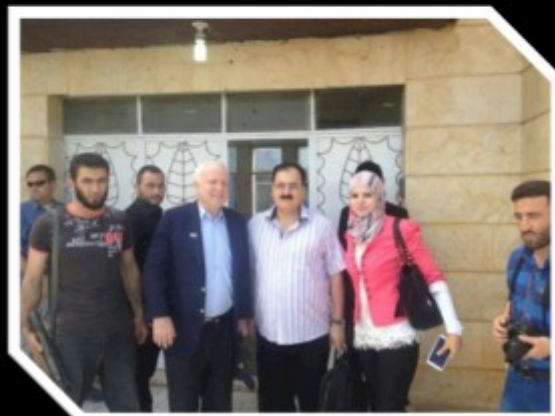
Syrie, 27 mai 2013

John Mc Cain visite les pays arabes printanisés : un simple contrôle de ses “investissements”